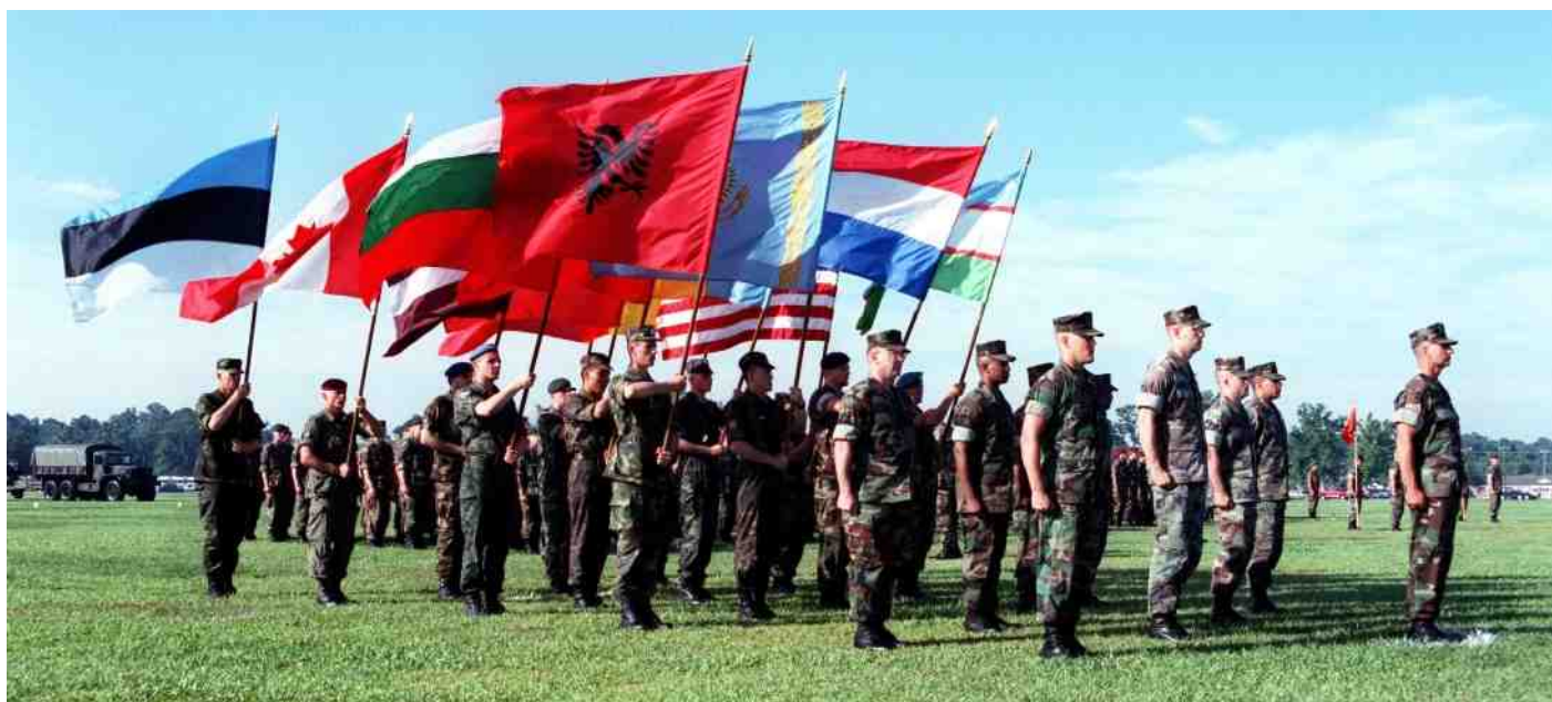
De aansluiting bij de NAVO werd gesteund door de meerderheid van de bevolking in de Baltische landen.