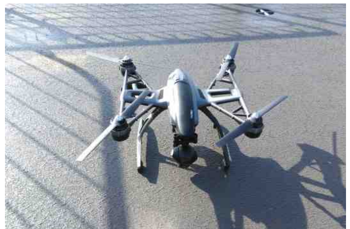
De Yuneec Typhoon Q500 drone is een effectieve aanvulling op de standaard 'ogen en oren' van een fregat of patrouillevaartuig.