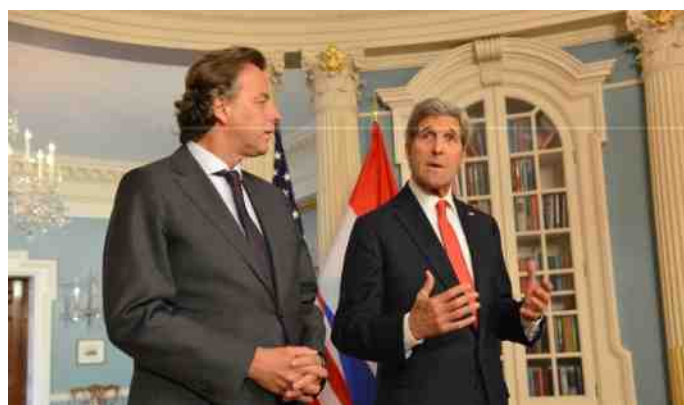
Minister Koenders in gesprek met de Amerikaanse Secretary of State John Kerry.

Volgens Koenders bevinden we ons op een 'kantelmoment'