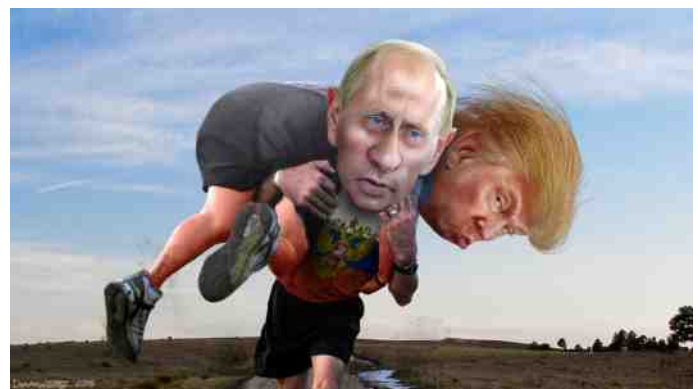
Poetin zal de wisseling van de wacht in Washington gebruiken.