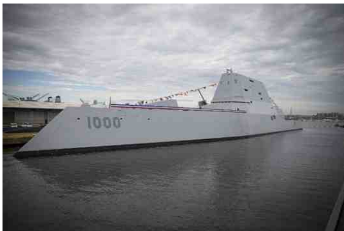
USS Zumwalt.