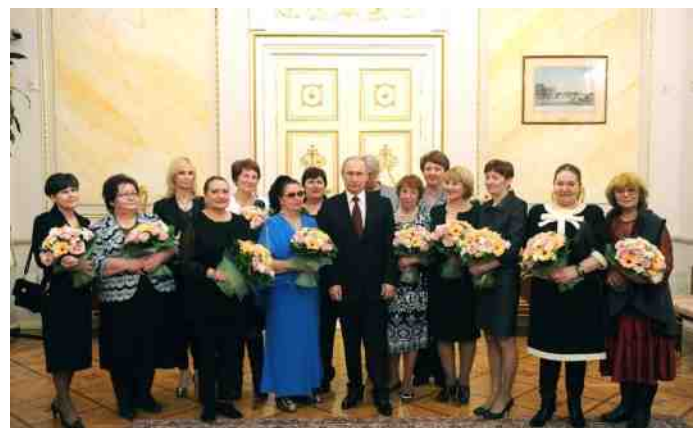
Volgens het Kremlin "valt het wel mee" met Poetin.