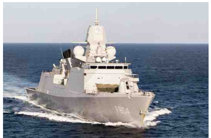
Zr. Ms. De Ruyter was tussen augustus en december 2016 in NAVO-verband actief op de Middellandse Zee