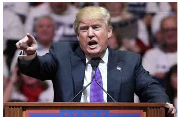
Europa komt nog bij van de verkiezingsoverwinning van Donald Trump.

Dit democratisch offensief heeft ontegenzeggelijk bijgedragen aan onrust, chaos en instabiliteit in de wereld en aan een merkwaardige, irrealistische categorisering van de politieke tegenstanders van dit beleid. Het regime van de Russische president Vladimir Poetin – waarlijk geen loepzuivere democraat – werd als even verwerpelijk gezien als dat van Islamitische Staat. Er was in dit Amerikaanse wereldbeeld geen ruimte meer voor nuances. Er was geen verschil tussen Rusland dat zich – terecht - bemoeide met zijn buitengrenzen en de directe nabuurschap Oekraïne, en Islamitische Staat dat met succes gewelddadige operaties uitvoerde op Europees grondgebied en inmiddels in 60 landen in de wereld terroristische acties pleegt. Gedreven door dit democratisch offensief, raakte de VS in een veelfrontenoorlog verstrikt. Bovendien werden door deze opstelling echte en vermeende tegenstanders van het Westen naar elkaar toe gedreven. Er ontstond een ontlukend anti-westers bondgenootschap van Rusland, China, Turkije en Iran. Om dit ontlukende bondgenootschap – de rest van de wereld – te onkrachten werd er een veel te toegankelijk akkoord met Iran gesloten waar Trump terecht op gewezen heeft. Het moet gezegd worden dat Europa onder Obama niets gedaan heeft om dit roekeloze, democratisch offensief te temperen.