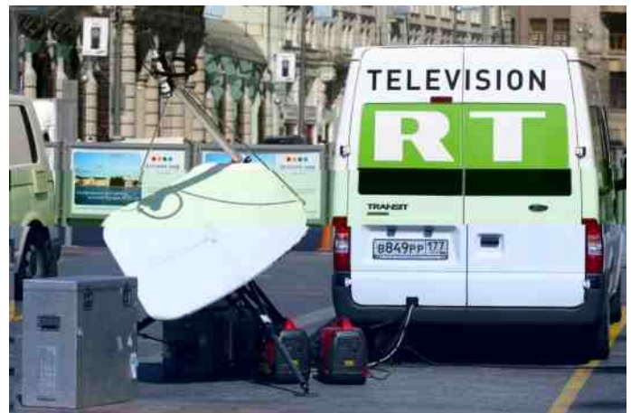
Berichtgeving uit het Kremlin wordt in het Westen vaak kritiekloos gekopieerd.

En "President Trump would be so much better for US-Russian relations. It can't be worse...". Vermoedelijk gaat hij er aan voorbij dat een aantal van die positieve uitspraken is gedaan in de periode dat Trump nog geen of weinig politieke ambities had en diens uitspraken na zijn verkiezing naar beneden zijn bijgesteld.