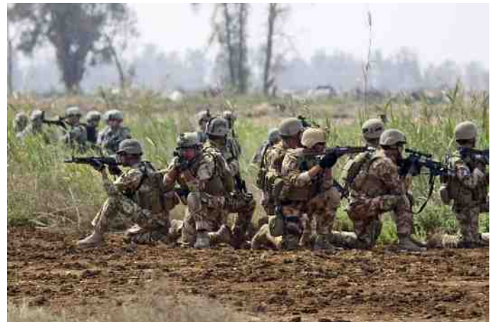
De VS raakte in een veelfrontenoorlog verstrikt.

Voor de steun aan het corrupte regime in Kiev zal Europa een hoge prijs betalen