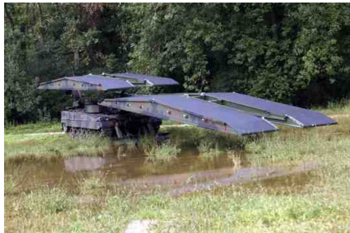
Een Leguan in actie.