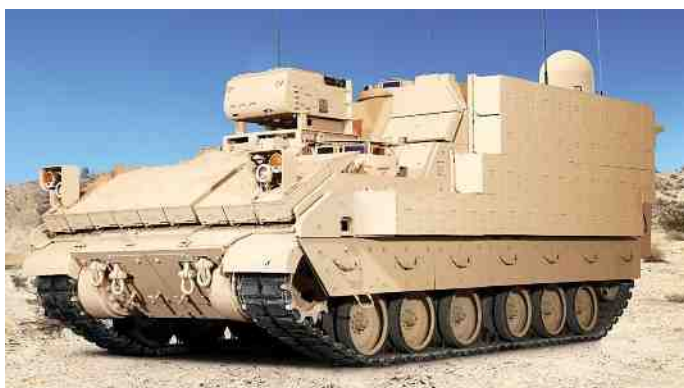
Het 'armored multi-purpose vehicle'.