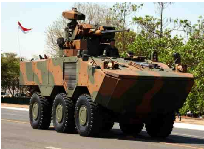
Een Guarani 6x6.