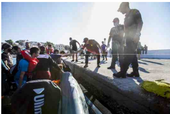
Toezicht op de Europese buitengrenzen.

Hiermee versmelten dus de vooral civiele EU-organisatie met de militaire inbreng van de NAVO-marines. Tevens toont deze ontwikkeling aan, dat de kustwachten van de EU-landen niet over voldoende middelen beschikken om de grensbewaking zelfstandig uit te voeren, als er grote aantallen vluchtelingen boten de zee op gaan. Het ontbreekt dan vooral aan mogelijkheden voor surveillance en observatie. De EU heeft overigens het initiatief genomen om zelf te voorzien in radarsystemen met een groot bereik. (zie kader)