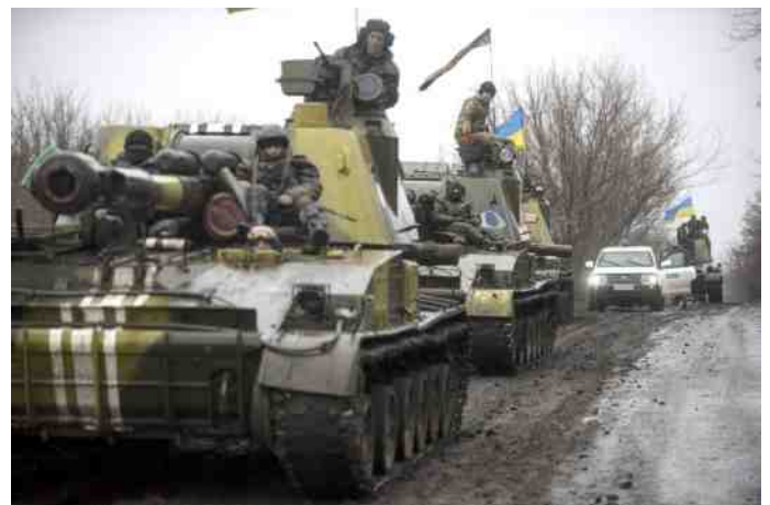
Waarschijnlijk zal er snel een einde komen aan de burgeroorlog in Oekraïne.