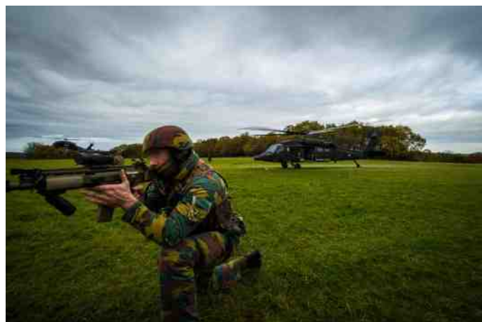
Europa dient zich op veiligheidsgebied te versterken.