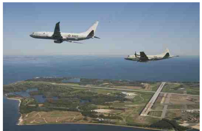
Een P-8a Poseidon en zijn voorganger, een P-3 Orion