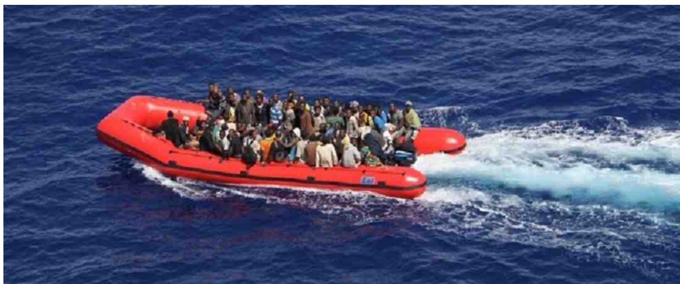
De Kustwacht heeft menige boot met vluchtelingen onderschept.

Ook de strijdkrachten van lidstaten van de EU en de NAVO spelen een rol bij de grensbewaking