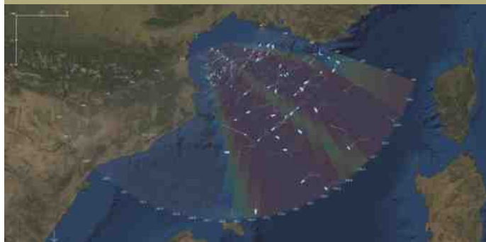
De eerste Stradivarius radar bestrijkt het noordwestelijk deel van de Middellandse Zee.

Een andere nieuwe mogelijkheid biedt Copernicus. Onder deze naam valt een uitgebreid systeem van de EU bestaande uit satellieten en grondapparatuur voor aardobservatie. Het is een initiatief van de Europese Commissie en de Europese ruimtevaartorganisatie ESA. Vijf verschillende soorten satellieten, aangeduid als Sentinel-1 tot en met -5, leveren data over onder andere weer en klimaat, grondgebruik en activiteiten op zee. De twee Sentinel-1 kunstmanen beschikken over een synthetic aperture radar. Hiermee kunnen schepen worden waargenomen. Gegevens van deze satellieten worden gebruikt door Frontex.