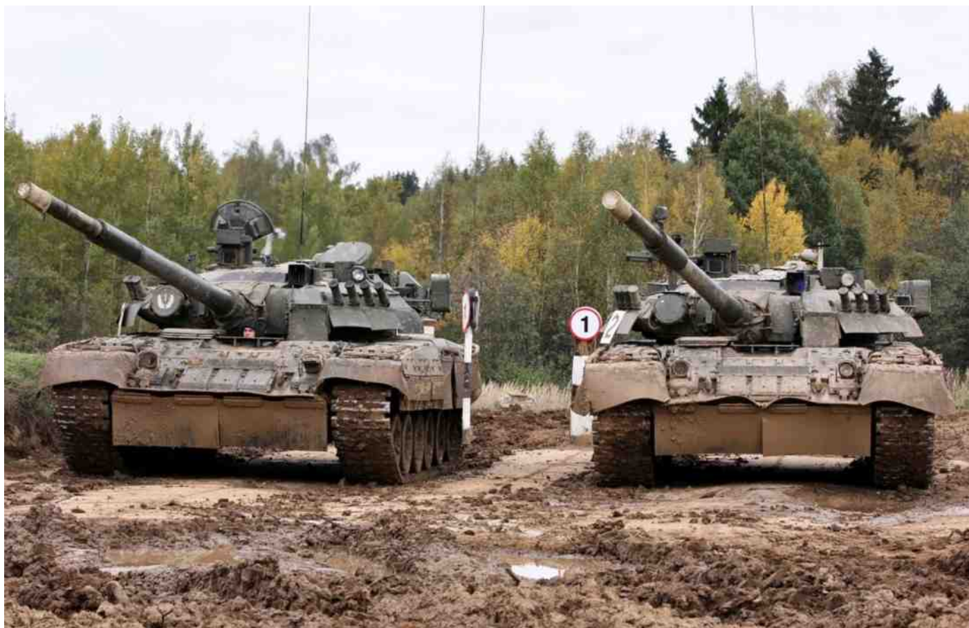
Rusland heeft onlangs een tankleger opgericht.