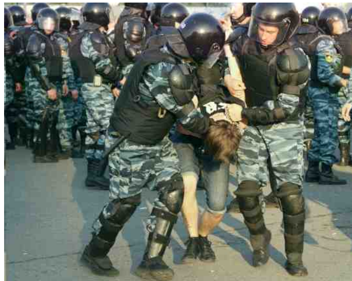
OMON-eenheden treden op tegen demonstranten.

22 November. Op de zender Mestro Vsrechi komt een reportage op het scherm waarin het beeld wordt geschetst, dat de Baltische Staten een slecht economisch-politiek beleid voeren, waarvan de burger de dupe is geworden. De betrokken staten zijn niet in staat de belangen van hun bevolkingen effectief te beschermen. Vanzelfsprekend in de reportage geen woord over het feit dat die staten zich zelfstandig uit het economische moeras hebben geworsteld, waarin ze in ruim 50 jaar economisch Sovjet wanbeleid gevallen waren. Geen woord of beeld over het feit dat die Baltische staten een schoolvoorbeeld zijn voor het Russische economische 'zigzagbeleid'. In 1995 was het BNP per hoofd van de bevolking in Letland: $2.327, in 2015 bedroeg dit $ 13.664! In Estland waren deze cijfers: 1995: 3.036 en in 2015: 17.295.