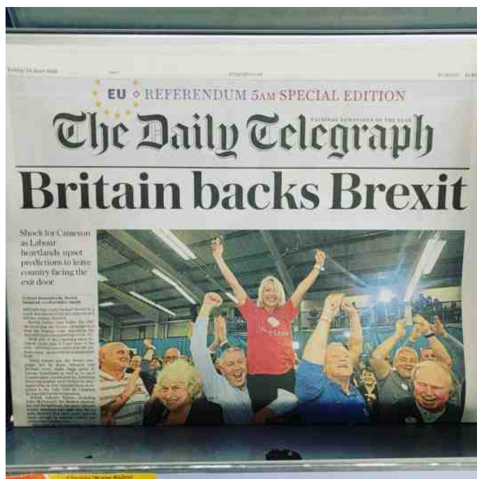
De Britse keuze voor Brexit is een voorbeeld van een kantelmoment.

Duitsland dient volgens Koenders de leidersrol op zich te nemen