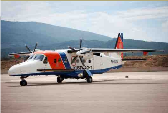
De Dorniers 228 van de Kustwacht hebben onder andere gevlogen van de Italiaanse basis Sigonella.

De taak van de Dornier en de bemanning was om illegale migratiepogingen van Noord-Afrika naar Europa te signaleren en in kaart te brengen, zodat de autoriteiten van de Europese kuststaten op de situatie konden anticiperen. Het toestel kon in geval van noodsituaties ook een bijdrage leveren aan zoek- en reddingsactiviteiten.