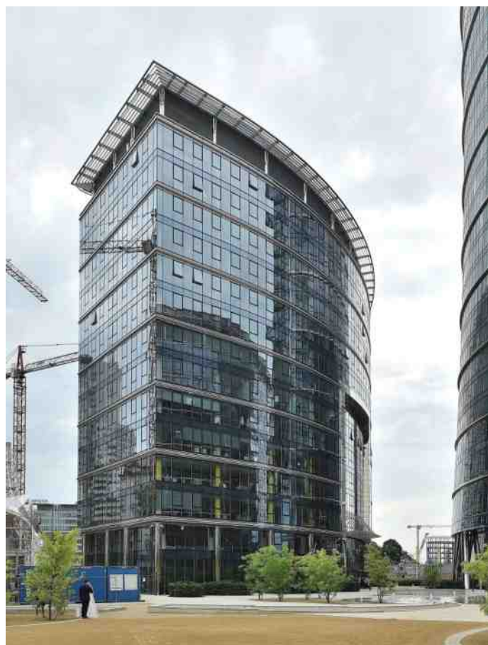
Het Frontex-hoofkwartier in Warschau.

Alle lidstaten samen moeten permanent 1.500 grenswachten paraat hebben staan