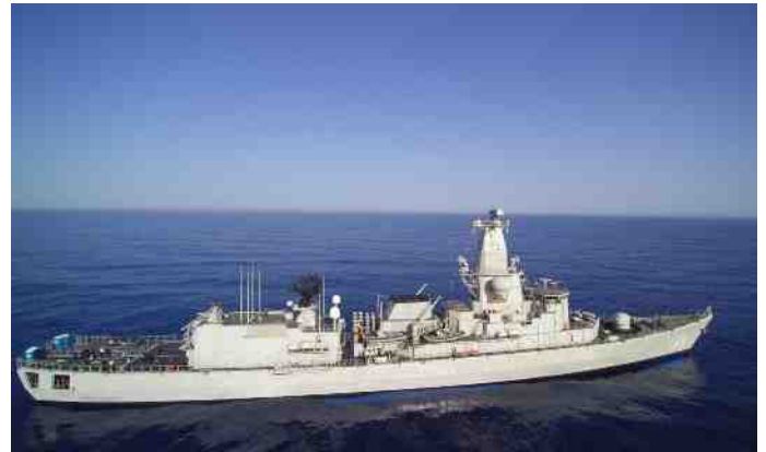
Zr. Ms. Van Amstel had de primeur van de inzet van een drone voor verkenningstaken.