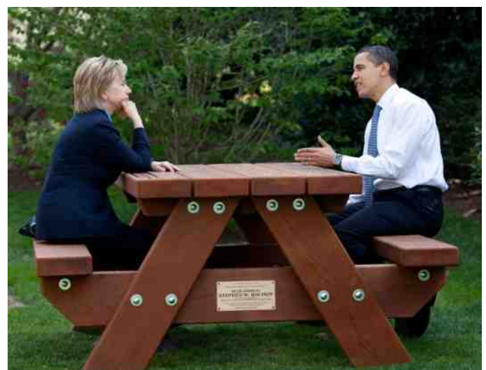
Overleg tussen Hillary Clinton en Barack Obama.

De nieuwe prioriteiten van Trumps buitenlandbeleid zullen de nodige aanpassingen in Europa vergen