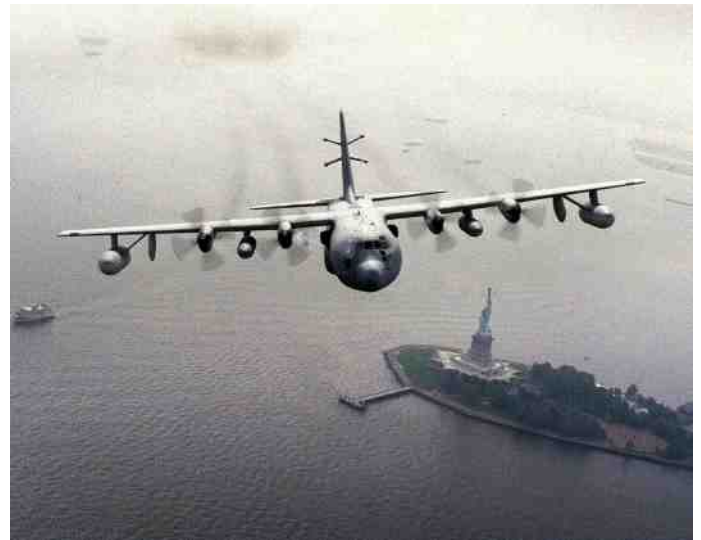
Een EC-130H Compass Call boven het Vrijheidsbeeld.