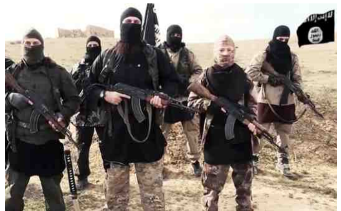
Trump ziet de radicale islam als een grote bedreiging.