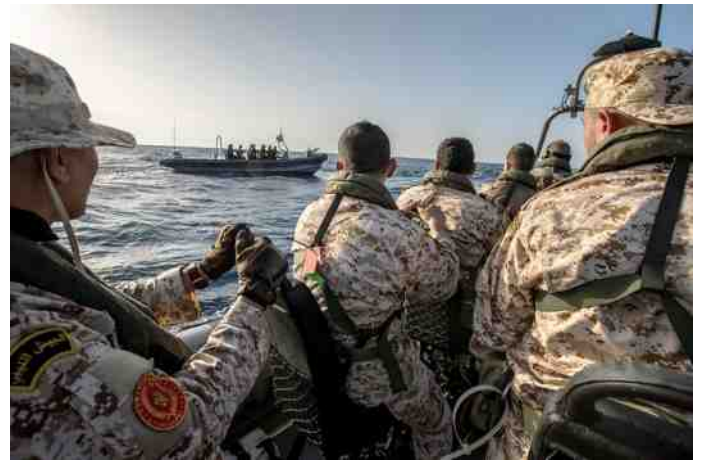
Libisch kustwachtpersoneel tijdens hun eindoefening.

De kustwachten van de EU-landen beschikken niet over voldoende middelen om de grensbewaking zelfstandig uit te voeren