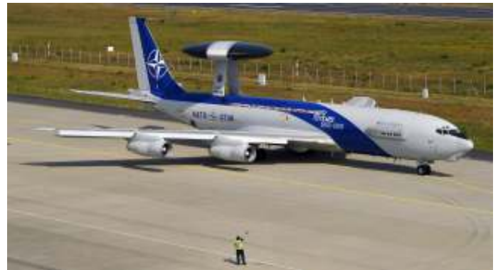
De NAVO bestond in 2019 zeventig jaar.

NAVO-landen hebben echter reden om ambivalent te zijn over de opkomst van China. Hoewel Beijing een stabiliserende rol heeft gespeeld in sommige gebieden van internationaal conflict en spanningen, heeft het havenfaciliteiten gekocht in Europese lidstaten van de NAVO. Daarnaast domineert Huawei, een Chinese firma, de Europese 5G-telecommunicatiemarkt. China tracht vooral met economische middelen haar invloed te vergroten.