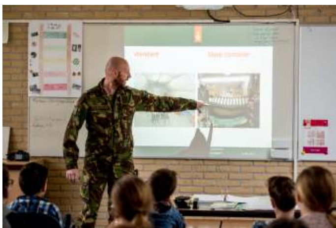
Het houden van een spreekbeurt valt onder extern optreden.