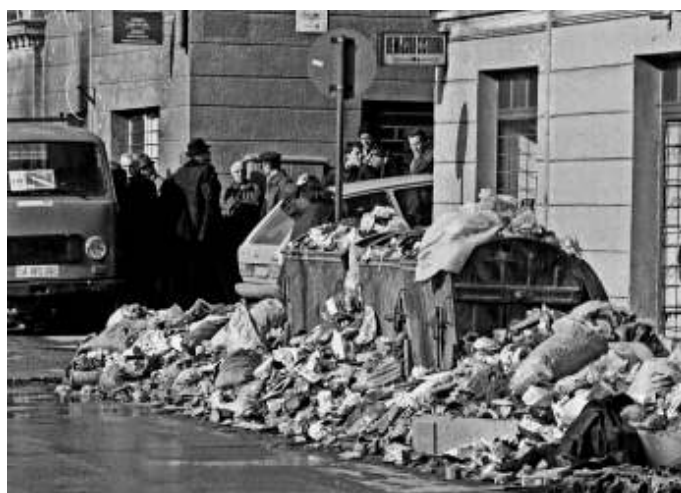
De Nederlandse VN-militairen zagen de ellende van de inwoners.