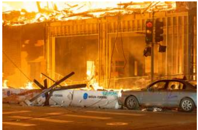
In de VS lijkt binnenlandse anarchie om zich heen te grijpen.