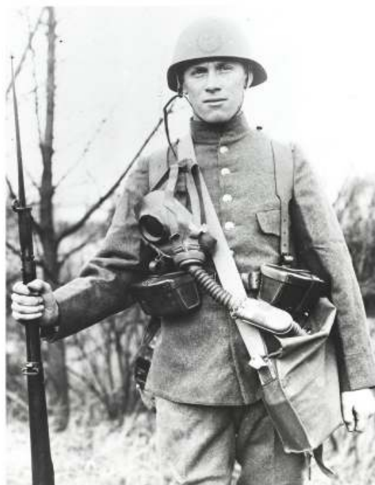
De Militaire Ambtenarenwet stamt uit 1931.