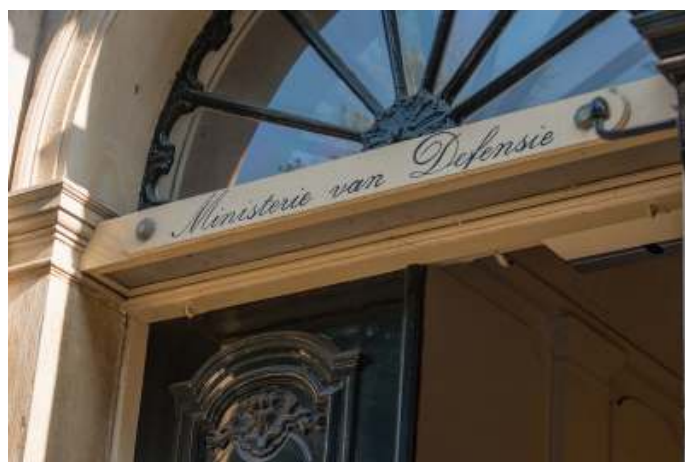
Het is in het belang van Defensie om zijn medewerkers te vertrouwen