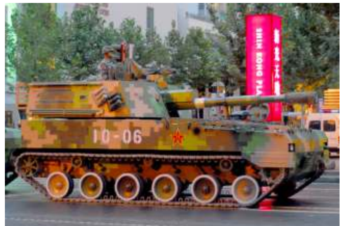
De NAVO slaat met bezorgdheid de militaire opbouw van China gade.

Trump zei in 2017 dat hij het bondgenootschap 'verouderd' vond