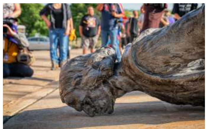
In Saint Paul (Minneapolis) werd het standbeeld van Christoffel Columbus van zijn sokkel getrokken.