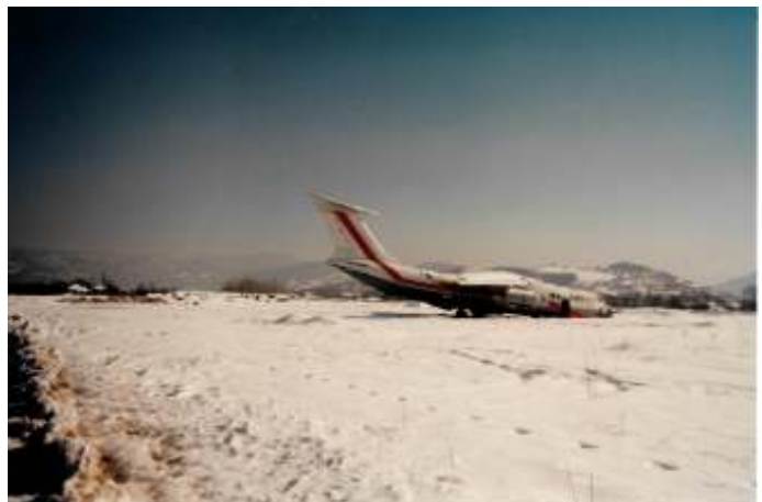
Het internationale vliegveld van Sarajevo was geregeld het doelwit van de beschietingen.