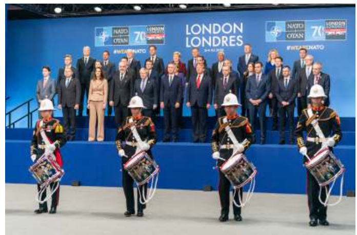
Zoals ook in het verleden bij NAVO-toppen was het 'eind goed, al goed' in Londen.

De NAVO heeft altijd spanningen gekend sinds de oprichting in 1949. Het einde van de Koude Oorlog, het wegvallen van de militaire aanwezigheid van de Sovjetvijand en de opkomst van populistische leiders als Trump hebben niettemin wel geleid tot een zekere erosie van de bondgenootschappelijke banden. De ruzies zijn feller en frequenter geworden en stellen de cohesie herhaaldelijk op de proef. Niettemin verklaart een aantal Europese politieke leiders bij herhaling, dat de veiligheid in Europa afhankelijk is van de Amerikanen. Ondanks de verhoogde Europese defensie inspanningen is dan ook vooralsnog geen sprake van een Europese strategische autonomie.