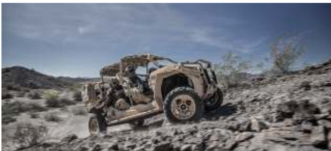
De vierzitsversie van de Polaris MRZR Alpha.