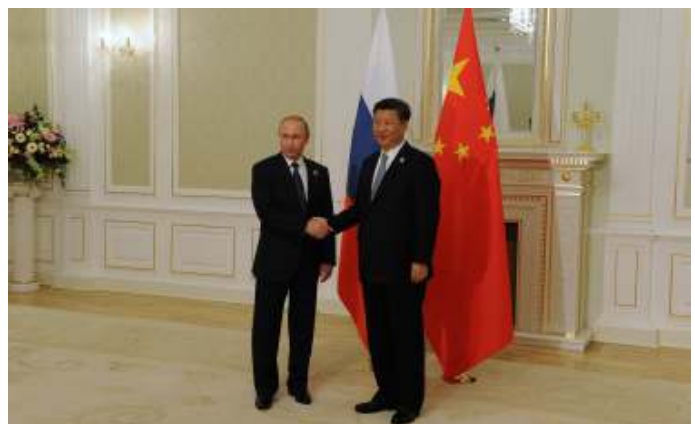
De Westerse expansie heeft Rusland onder president Poetin in de armen van China gedreven.