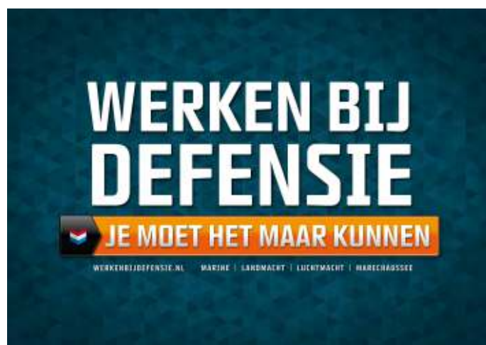
Van militairen wordt meer verwacht dan van de gemiddelde burgerwerknemer.