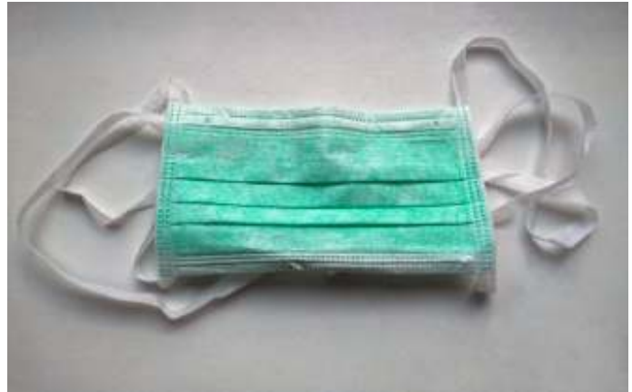
Het Westen is voor zo iets eenvoudigs als mondkapjes afhankelijk geworden van China.