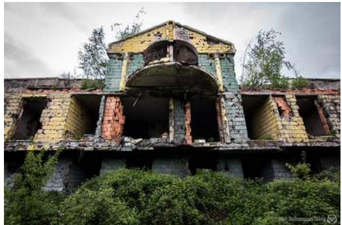
De VN-militairen waren gelegerd in het Rainbow Hotel, dat in mei 1992 zwaar werd beschoten.