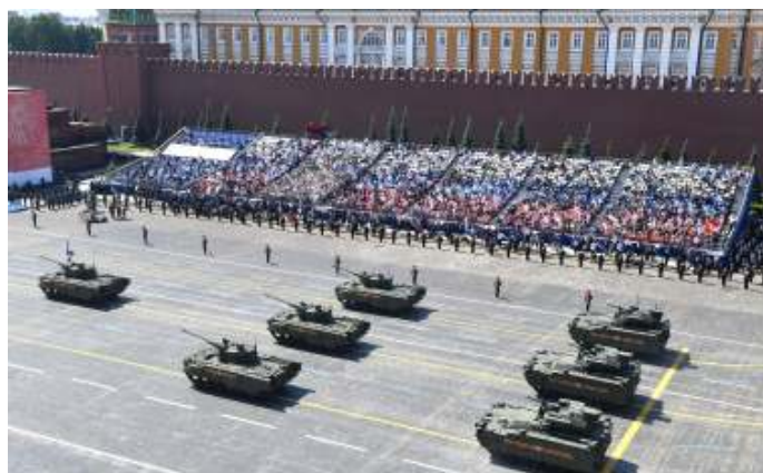
2538 luchtverdedigingsvoertuigen en BMPT 'Terminator' gepantserd ondersteuningsvoertuig