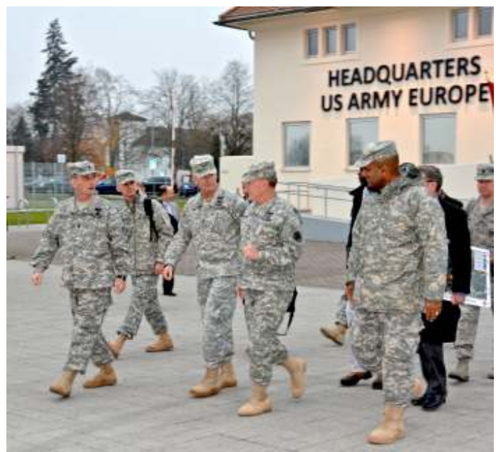
Trump heeft recent besloten 9.500 Amerikaanse militairen uit Duitsland terug te trekken.

Bovendien ontstond een nieuw probleem voor het bondgenootschap door het recente besluit van Trump 9.500 Amerikaanse militairen uit Duitsland terug te trekken. Kortom, bij de NAVO is er nooit sprake van 'a dull moment'!