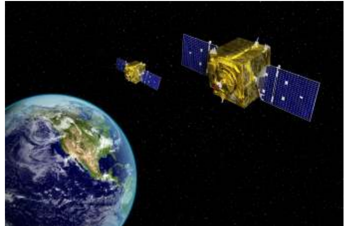
De NAVO-top in Londen verklaarde de ruimte als nieuw operationeel domein.

Cyberspace was reeds in 2016 tot nieuw strijddomein verklaard, naast land, zee en lucht. Sindsdien omvat cyberdefensie maatregelen die de NAVO neemt om zich te beschermen tegen cyberaanvallen op haar communicatie- en informatie-infrastructuur. De complexiteit van die aanvallen zorgt dat 'cyberdefensie' een kerntaak in de Alliantie is geworden.