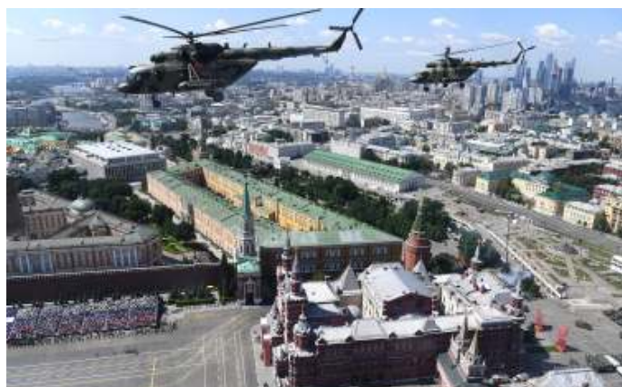
Mi-8 'Hip' helikopters