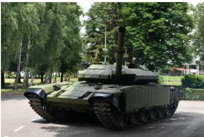
De M-84 AS1 gevechtstank.