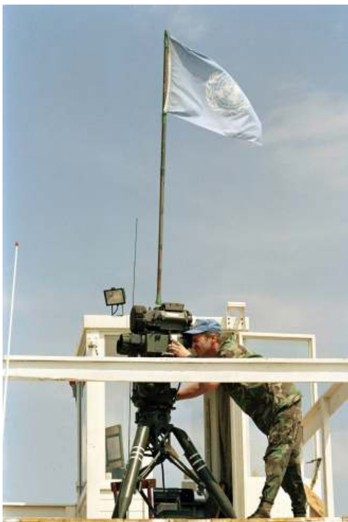
De VN was geen doelwit.

Hoe was het voor het Nederlandse verbindingsonderzoeksteam en de Nederlandse waarnemers om in een stad te verblijven die dagelijks werd beschoten? Hoe gingen zij om met de vreselijke omstandigheden die de bevolking werd aangedaan? De inwoners leefden meer dan twee jaar onder vreselijke omstandigheden, met weinig voedsel, brandstof, water en de constante angst voor de granaten en sluipschutters. De VN-vredesmacht werd verboden een helpende hand toe te steken aan de bevolking, omdat dit de neutraliteit zou schenden. Aan alle kanten werd er toch aan de VN-militairen getrokken; inwoners verwachtten hulp. De manier waarop Nederlandse militairen hier mee omgingen is aan de hand van vijf egodocumenten[1] en vijf interviews[2] onderzocht.