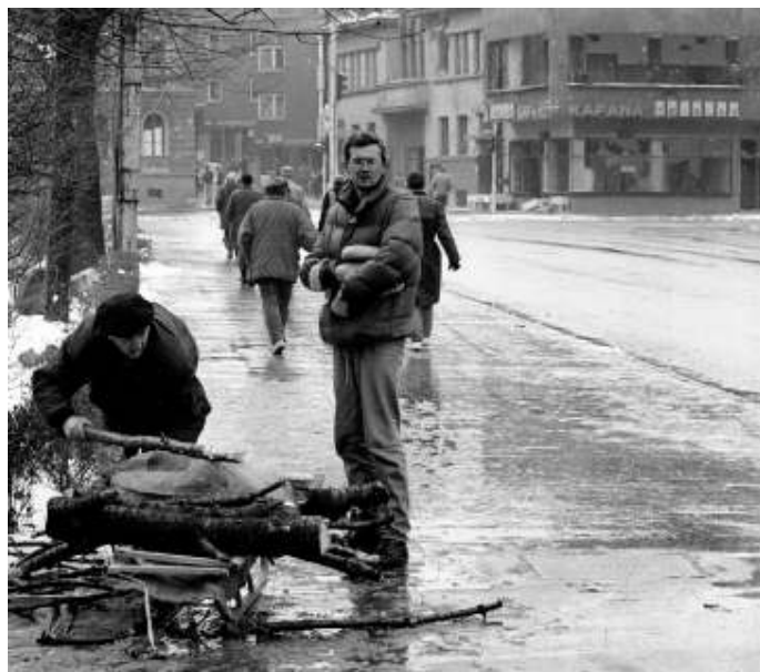
De inwoners van Sarajevo leefden meer dan twee jaar onder vreselijke omstandigheden.