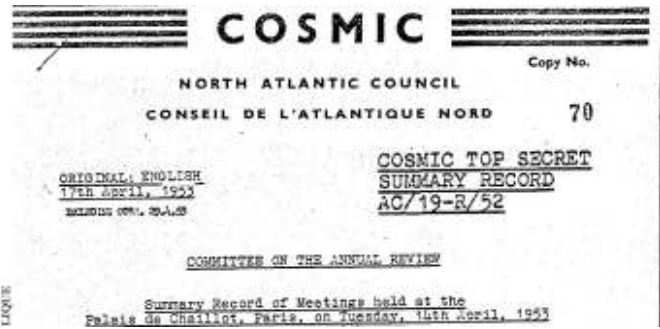
Het niet publiceren van gerubriceerde informatie val onder ieders verantwoordelijkheid voor de wet.

Het keurslijf voor de militair in de omgang met de media is behoorlijk aangetrokken