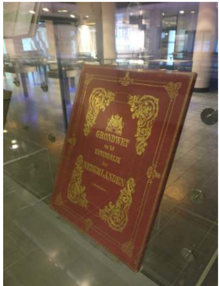
De vrijheid van meningsuiting is verankerd in de Grondwet.

Het keurslijf voor de militair in de omgang met de media is behoorlijk aangetrokken