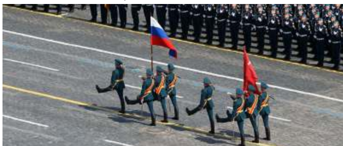
De start van de parade