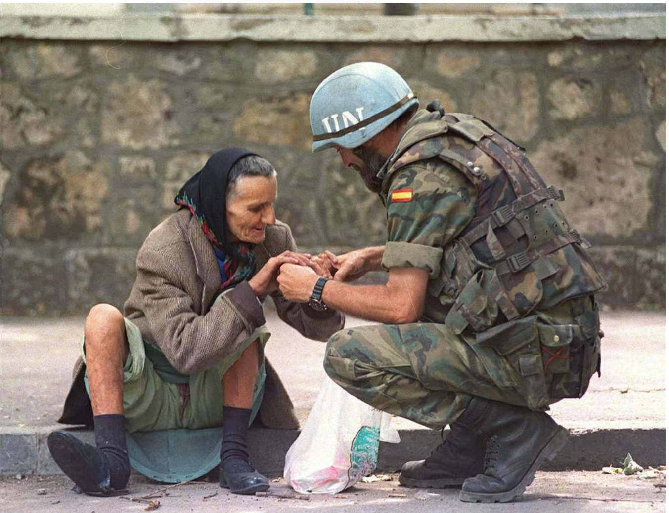
Sommige militairen probeerden meer te doen dan was toegestaan.

Het was de VN-militairen verboden de bevolking van Sarajevo te helpen