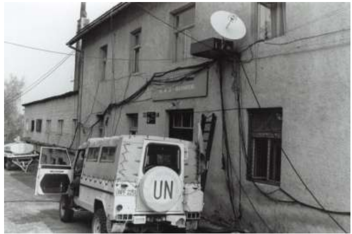
Het Nederlands verbindingsbataljon droeg zorg voor de communicatie tussen de diverse eenheden van UNPROFOR.