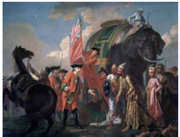
Sinds 1492 werden wereldrijken altijd aangevoerd door een Westerse staat. Afbeelding: Francis Hayman, National Portrait Gallery

Het coronavirus: de katalysator die de globale machtsverhoudingen definitief omkeerde