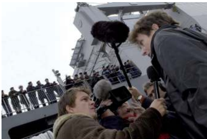
Defensie is heel strikt waar het contacten met journalisten betreft.