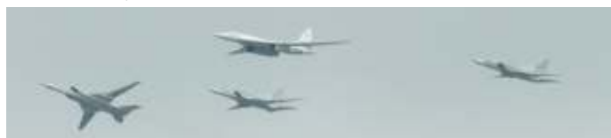
Een Tu-160 'Blackjack' strategische bommenwerper, begeleid door drie Tu-22M 'Backfires'.