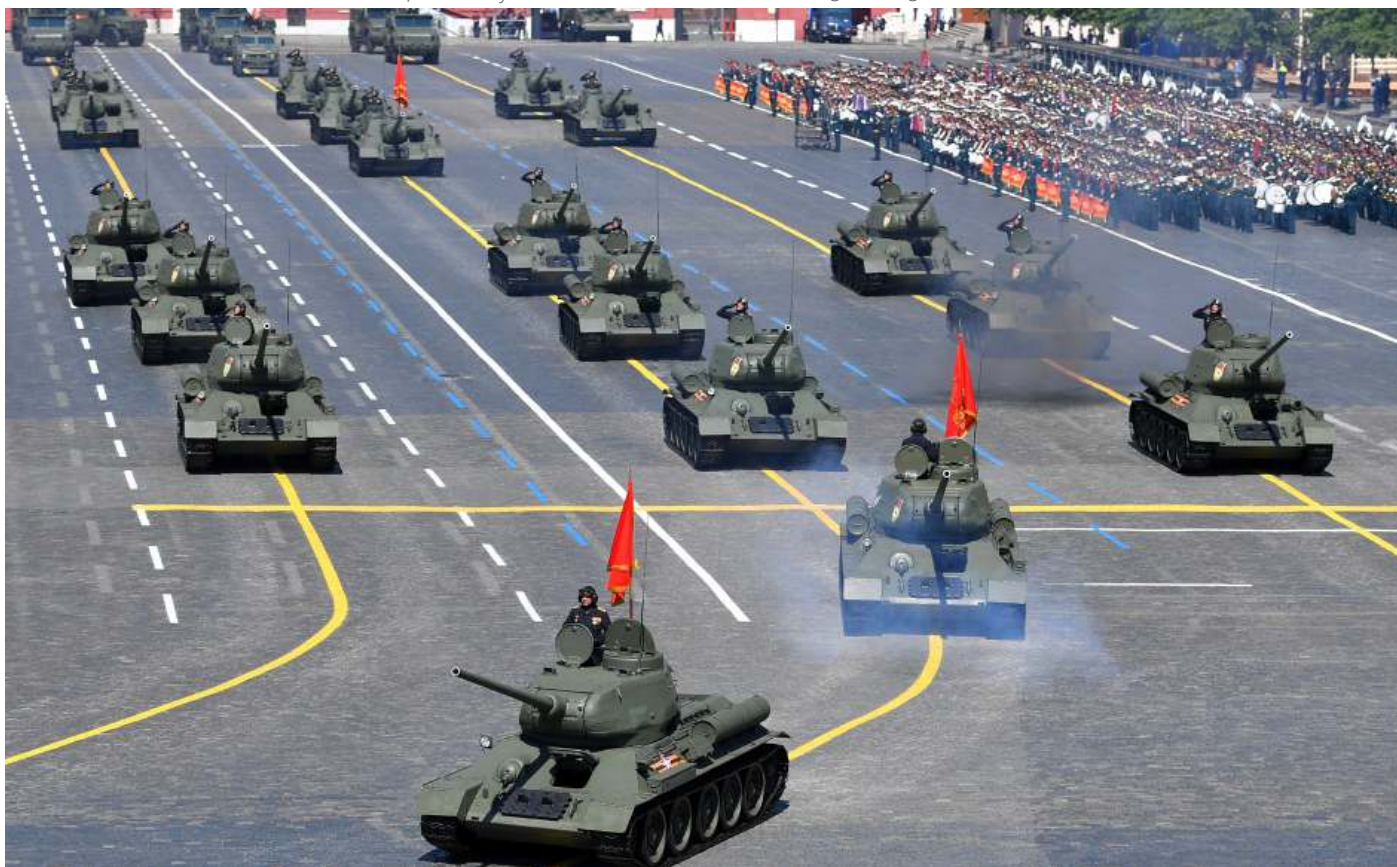
T-34/85 tanks gevolgd door SU-100 gemechaniseerd geschut. Beide uit de Tweede Wereldoorlog