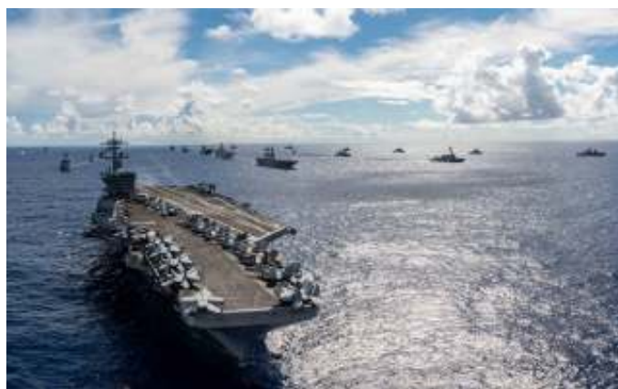
Een Amerikaans vlooteskader in de Pacific. Het Amerikaanse streven is nog steeds China ervan te weerhouden geweld tegen Taiwan te gebruiken.