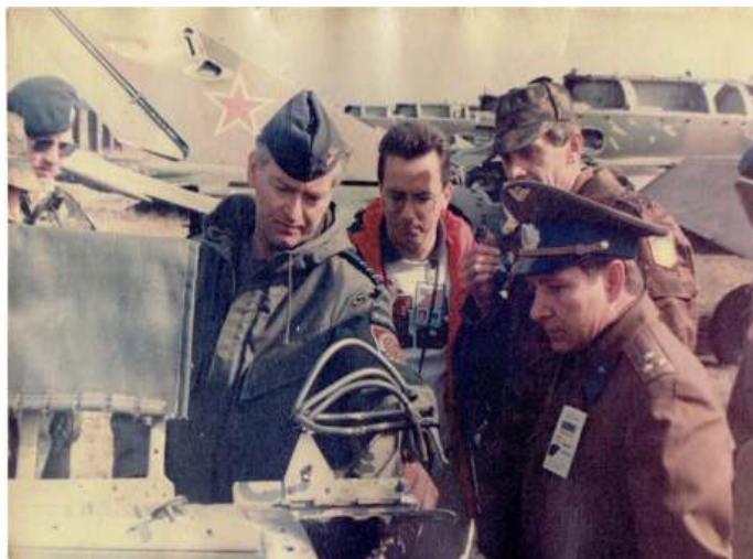
De auteur (midden) tijdens een door Nederland geleide wapeninspectie in Belajura (1996). Op de voorgrond een Oekraïense waarnemer. De man in burger is een Amerikaanse inspecteur.

De Russische Federatie werd alom gezien als de erfopvolgerstaat van de SU, dus ook van het Rode Leger [2], maar de andere republieken wilden daar eveneens een deel van. Dat bracht opsplitsingsproblemen met zich mee. De details daarvan laat ik hier rusten, maar ik wil wel even kort ingaan op enkele aspecten, zoals de herplaatsing van de Sovjetkernwapens. Op 5 december 1994 hebben de Russische Federatie (RF, Rusland), de Verenigde Staten en het Verenigd Koninkrijk veiligheidswaarborgen toegezegd aan de kernwapenstaten Oekraïne, Wit-Rusland en Kazachstan in het zgn. Memorandum van Boedapest. In ruil daarvoor zouden deze voormalige Sovjet-landen de kernwapens op hun grondgebied aan Rusland overdragen en toetreden tot het internationale Non-proliferatieverdrag als niet-nucleaire wapenstaten. Frankrijk en China gaven een enigszins afgezwakte vorm van deze veiligheidsgaranties.