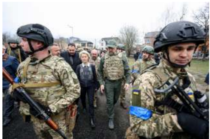
Mevrouw Von der Leyen heeft bijgedragen aan het bij ons overheersende schelpe beeld van de situatie.