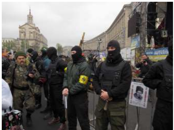
De invloed van radicale nationalistes is groot in Oekraïne.