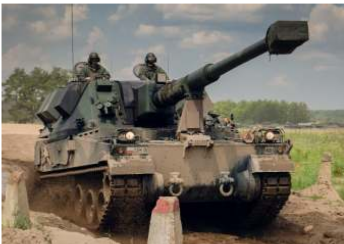
De Poolse AHS Krab 155mm houwtwer. Polen heeft al 18 stuks hiervan aan Oekraïne geleverd en er nog eens 54 toegezegd.