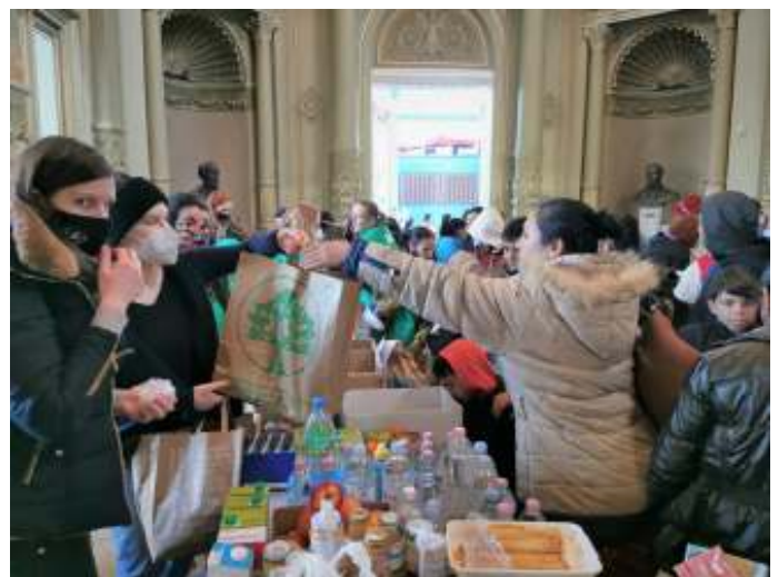
Inmiddels zijn er al meer dan een half miljoen Oekraïense vluchtelingen in Hongarije toegelaten.

Inmiddels heeft ook Kroatië, dat onlangs de euro invoerde, zich aangesloten bij de Hongaarse positie. Tijdens een recent staatsbezoek aan Hongarije uitte de Kroatische president Zoran Milanovic vernietigende kritiek op de EU-sancties die volgens hem geen effect hebben en riep de EU de verdere escalatie van de oorlog te voorkomen. Kroatië had zich al eerder teruggetrokken uit het NAVO-trainingsprogramma voor Oekraïense rekruten op haar grondgebied. Het is duidelijk dat Kroatië niet bij de verdere escalatie van de oorlog betrokken wil raken en ook niet afgesloten wil worden van Russische gasleveringen die alleen nog via de Zwarte Zee en Turkije, de zogeheten Turk Stream, de Balkan bereiken. Deze positie wordt ook ingenomen door het wispelturige buurland van Kroatië, het EU-kandidaatland Servië. Hoewel de Servische president Alexander Vucic zich recentelijk uitsprak tegen de deelname van Servische huurlingen in het Russische huurlingenlegioen, de Wagner-groep, is de Servische president een fel tegenstander van de EU-sancties die de traditionele banden met bondgenoot Rusland schade toe-