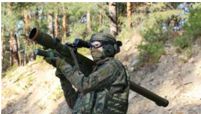
Een Noorse militair vuurt een Piorun af.