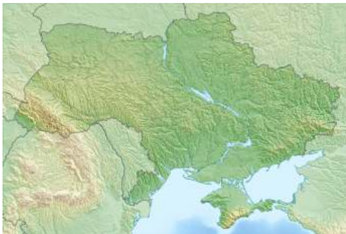
Op 1 juli 1991 was Oekraïne in plaats van een Sovjetrepubliek een onafhankelijke, soevereine staat geworden.

Vanaf de eerste dag maakten de Oekraïners ons duidelijk dat 'Oekraïne' als natie niet bestond