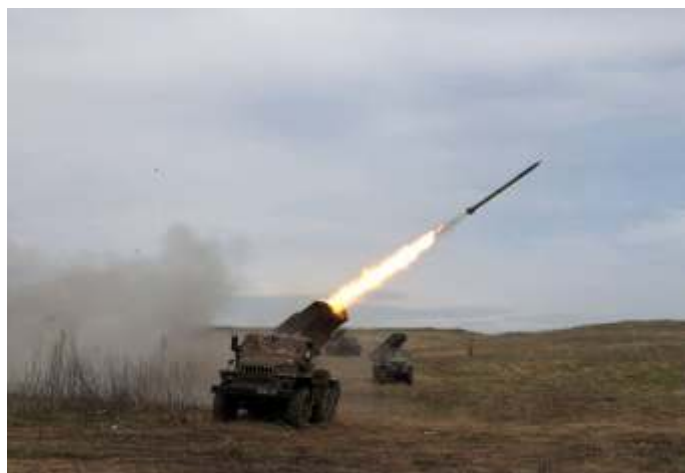
Een Oekraïense BM-21 'Grad' in de regio Loehansk. In de tweede helft van 2021 en het begin van 2022 was sprake van concentraties van Oekraïense troepen aan de grenzen van Donbas.