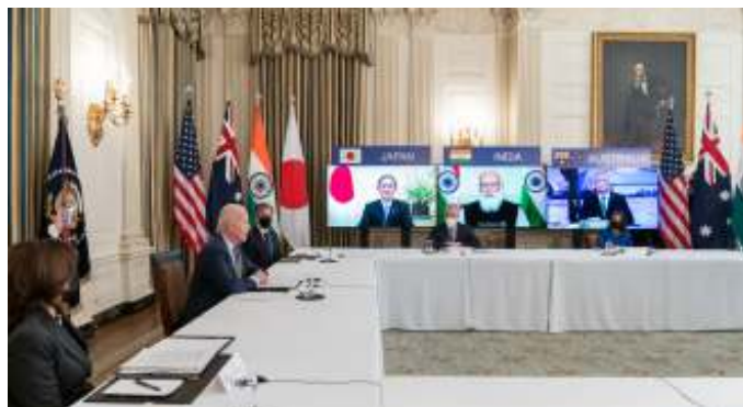
De Verenigde Staten moeten met bondgenoten en partners samenwerken, zoals de versterkte Quad.

Een conflict over Taiwan zou leiden tot mondiale economische schokken