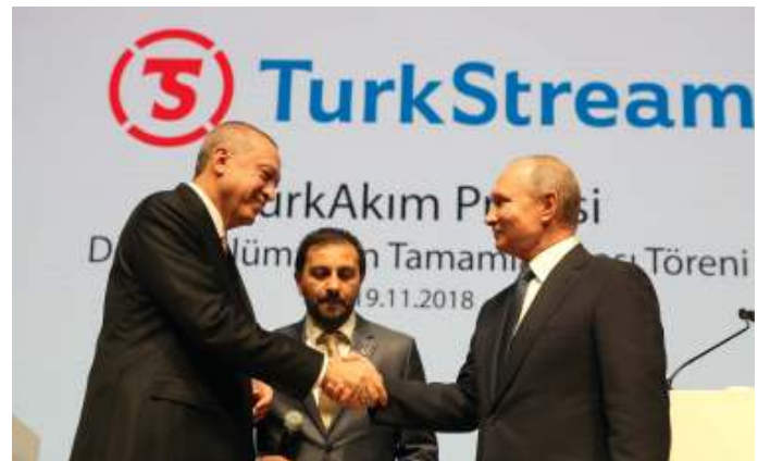
De presidenten Erdogan en Poetin tijdens de officiële opening van de TurkStream pijpleiding.