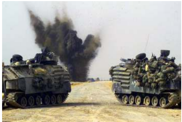
Amerikaanse mariniers in Irak in maart 2003. Ook de VS hebben de soevereiniteit van landen geschonden, zoals die van Irak.