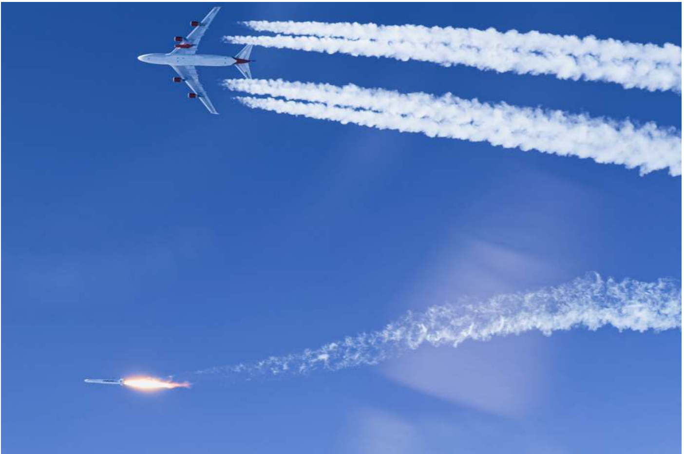
De lancering is begonnen, nadat de raket met de Brik II door het moederschip is losgelaten.