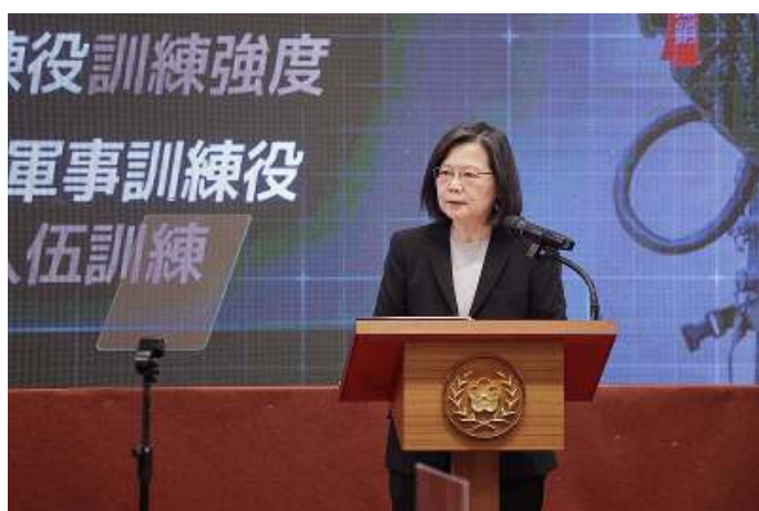
Onder de in 2016 als president verkozen Tsai Ing-wen verslechterden de betrekkingen tussen China en Taiwan.