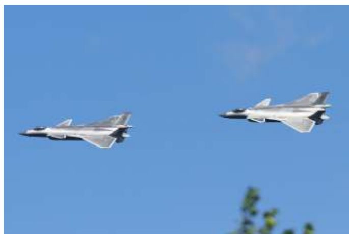
Twee Chinese J-20 jachtvliegtuigen. Beijing heeft sinds de verkiezing van Biden de invallen van militaire vliegtuigen in de luchtverdedigingszone van Taiwan opgevoerd.