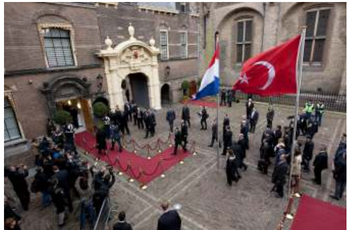
Ontvangst van een Turkse delegatie in Den Haag. Volgens de AIV moet ons land vasthouden aan zijn principes, maar tegelijkertijd proberen deals te sluiten met Ankara.

Hoewel Erdogan een schandalig mensenrechtenbeleid voert, is Turkije geopolitiek van groot belang