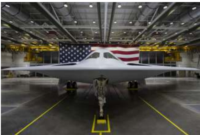
De B-21 tijdens de 'roll out'.