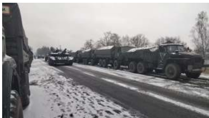
Russische troepen in de omgeving van Kiev, maart 2022. De Russen hebben hun eigen mogelijkheden overschat.