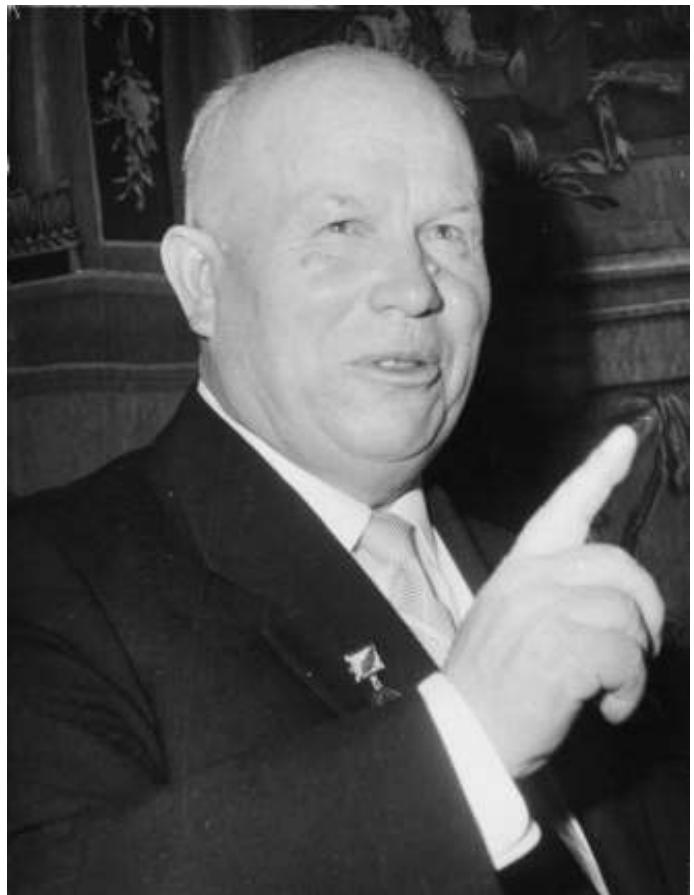
Nikita Chroesjtsjov droeg de Krim in 1954 – eigenlijk illegaal – over aan Oekraïne.

Voor een serieuze samenwerking met de landen in Centraal- en Oost-Europa had de Amerikaanse president Bush senior de deur al dichtgegooid in zijn gesprek met Helmut Kohl op 24 februari (sic!) 1990 in Camp David. Er