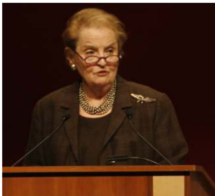
Bill Clintons minister van Buitenlandse Zaken Madeleine Albright. Zij was van Tsjechische komaf en bezat een grondige afkeer van alles wat Russisch was.