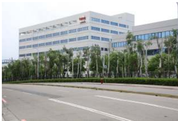
Een fabriek van chipsfabrikant TSMC in Hsinchu (Taiwan). China is sterk afhankelijk van Taiwanese chips.

Ten slotte moet niet vergeten worden, dat een Chinese verovering van het eiland tevens ernstige gevolgen zou kunnen hebben. Elke bondgenoot en partner van de Verenigde Staten zou zijn afhankelijkheid van dit land voor veiligheid opnieuw kunnen overwegen en mogelijk kiezen voor verzoening met China of voor een vorm van strategische autonomie. Een conflict over Taiwan zou ook leiden tot mondiale economische schokken vanwege Taiwans dominante rol in de vervaardiging van geavanceerde halfgeleiders. Vooral nog lijkt Taiwan dan ook op een 'bevroren conflict'!