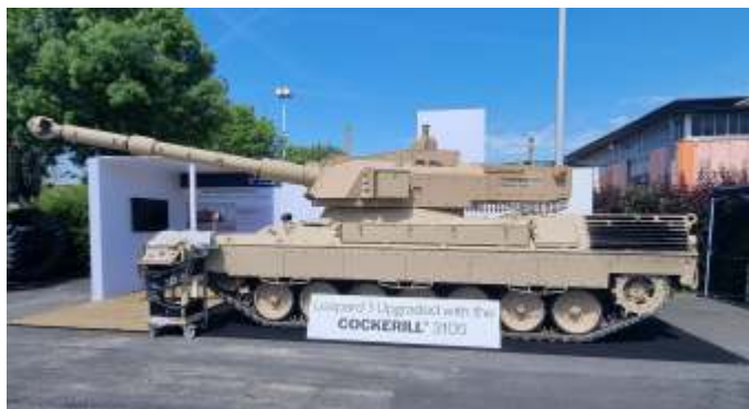
De gemodificeerde Leopard 1 met Cockerill 3105 toren tentoongesteld.

De toren is voorzien van modern richtmiddelen en een digitaal vuurleidingsstelsel. Verder is de toren uitgerust met acht rookgranaatwerpers, een actief beschermingssysteem en akoestische schotdetectie.