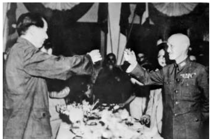
Na 1945 brak op het vasteland van China een burgeroorlog uit tussen nationalistische regeringstroepen onder leiding van Chiang Kai-shek (rechts) en de Communistische Partij van Mao Zedong (links).