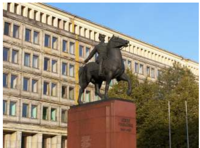
De Poolse regering ziet het geopolitieke plan van wijlen Jozef Pilsudski voor haalbaar en uitvoerbaar.