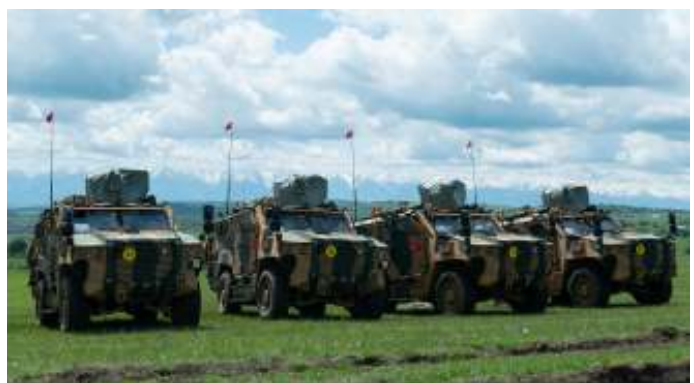
Turkse pantservoertuigen als onderdeel van de VJTF in Roemenië. geopolitieke rol van NAVO-bondgenoot Turkije is belangrijker dan ooit.