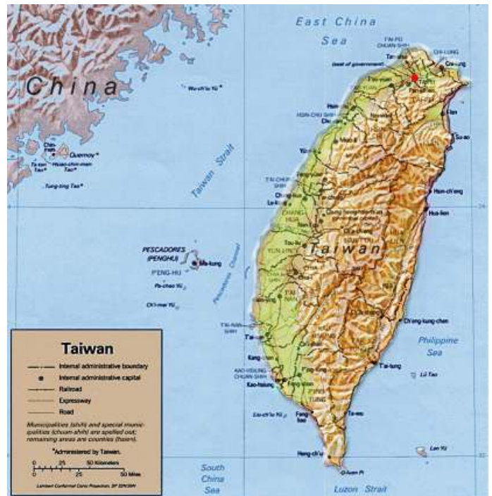
Taiwan is een eiland, ongeveer 100 mijl van de kust van Zuidoost-China.

Maar tegen de jaren '70 meenden sommige landen dat de regering van Taipei niet langer kon worden beschouwd als een echte vertegenwoordiger van de honderden miljoenen mensen die op het vasteland van China woonden.