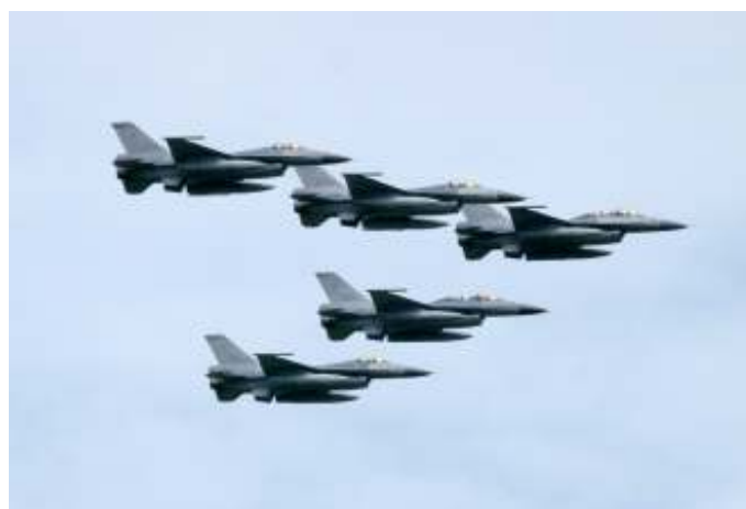
Taiwanese F-16's. Taiwan beschikt over 504 vliegtuigen, terwijl China er 3.227 heeft.