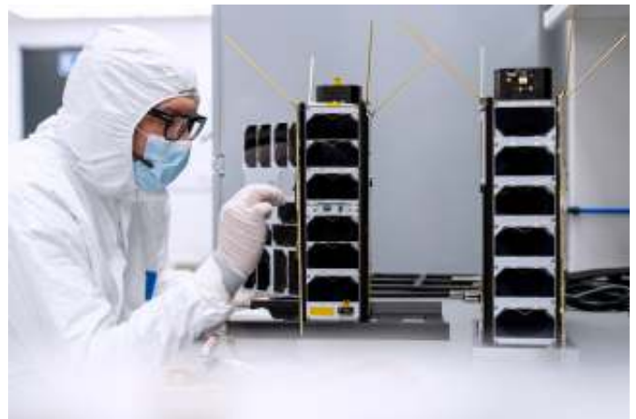
Birkeland en Huygens tijdens de bouw.

De twee satellieten zijn ontwikkeld binnen het MilSpace2-programma. Dat is een in 2015 gestart samenwerkingsproject van de Nederlandse en Noorse ministeries van Defensie, het Noorse militaire FFI-onderzoeksinstituut, producent NanoAvionics en de Nederlandse kennisinstellingen NLR en TNO. Dat gebeurde in het kader van de Strategic Mutual Assistance in Research and Technology (SMART) en het militair gebruik van de ruimte (MilSpace). Van-