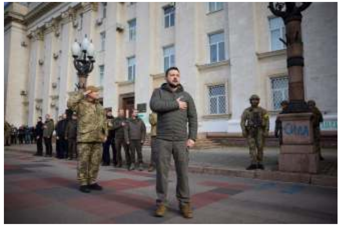
Zelenski in Cherson. Alle verregaande beschuldigingen van hem worden klakkeloos 1-op-1 overgenomen door westerse politici en media.

Ook de beschuldigingen van Zelenski over 'genocide' hebben tot nu toe weinig substantie gekregen. Uiteraard werd de massamoord in Boetsja eind maart/begin april door Rusland ontkend, maar dat interesseerde in het Westen niemand. De beelden die echter op 2 april door de Oekraïense Nationale Politie zijn gemaakt en verspreid, tonen lijken zonder verkleuringen en zwellingen, dus ze waren van recente datum. Van belang is te weten dat de temperatuur in de maanden maart en april in Kiev en omstreken niet onder nul was geweest. Op 1 april was de gevluchte burgemeester van Boetsja teruggekeerd en had een publieke toespraak gehouden waarin hij geen enkele melding had gedaan van massamoorden. De Russische militairen waren toen trouwens al vier dagen de stad uit. Op de foto's zijn lijken zichtbaar met een witte armband, zoals gebruikelijk is bij Oekraïners die collaboreren met de Russen. Was het een afrekening met collaborateurs door de Oekraïense Nationale Politie? Redenen genoeg om de zaak maar eens grondig te onderzoeken, in plaats van onmiddellijk met beschuldigende vinger naar de 'wrede Russische militairen' te wijzen.