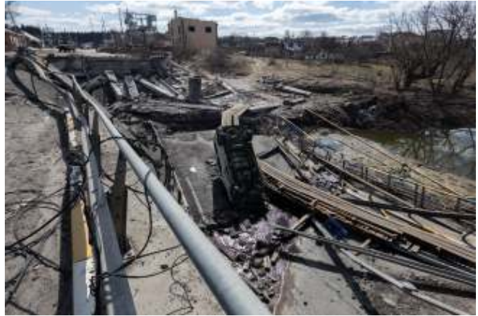
De artilleriebeschietingen van infrastructurele knooppunten in Oekraïne kunnen nog een flinke tijd doorgaan.

De mainstream positie van de EU om Oekraïne te helpen bij de legitieme strijd voor het behoud van haar soevereiniteit staat in MOE van twee kanten onder druk. Noord-Midden-Europa wil koste wat kost - desnoods met het risico van een Derde Wereldoorlog zoals premier Morawiecki meermaals heeft verklaard - een meer actieve inzet van het Westen op het Oekraïense slagveld zelf. Deze houding leidt zeker tot een verdere escalatie, terwijl landen in Zuid-Midden-Europa het conflict willen de-escaleren. Tot overmaat van ramp voor Ursula von der Leyen, de voorzitter van de Europese Commissie die de lidstaten in het Oekraïne-conflict op een lijn wil krijgen en houden, staan de beide MOE-groepen niet alleen tegenover elkaar, maar trekken ze juist weer samen op in hun strijd tegen datzelfde Brussel dat vooral Polen en Hongarije dreigt te sanctioneren vanwege de gebreken in het functioneren van de rechtsstaat.