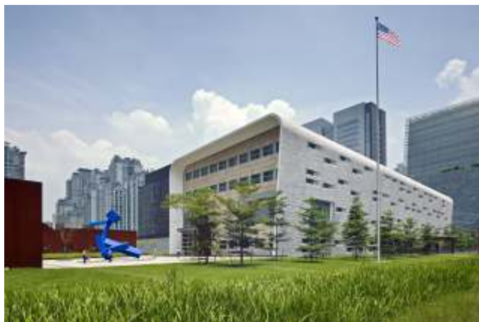
Amerikaans consulaat in Guangzhou. De Verenigde Staten vestigden formeel diplomatieke banden met Beijing in 1979.

Hoewel een groot deel van China's militaire macht elders is gericht, is er een enorme onevenwichtigheid tussen de twee partijen. Sommige westerse experts voorspellen dat Taiwan in een open conflict in het beste geval zou kunnen proberen een Chinese aanval te vertragen, te proberen een kustlanding door Chinese amfibische troepen te voorkomen en guerrilla-aanvallen uit te voeren in afwachting van hulp van buitenaf. Die hulp zou kunnen komen van de Verenigde Staten, die wapens verkopen aan Taiwan. President Biden heeft inmiddels diverse malen verklaard Taiwan bij Chinese agressie te hulp te snellen.