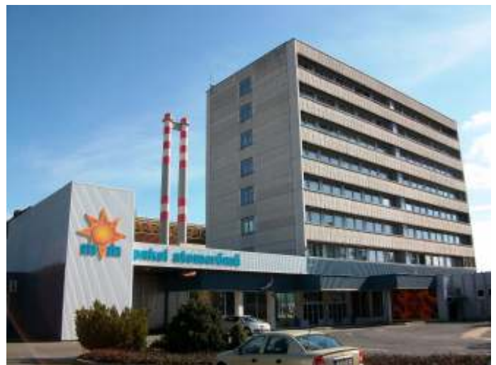
Hongarije is afhankelijk van Rusland voor verrijkt uranium dat als brandstof dient voor de enige kerncentrale van het land in Paks.