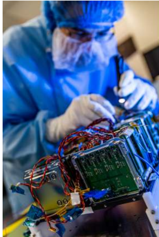
De Brik II.

Een dikke eeuw na de eerste vlucht vormt ook de Brik II een experimenteel project van de Koninklijke Luchtmacht. "Zijn lancering was een eerste test om het potentieel van nanosatellieten voor militair en civiel gebruik aan te tonen. De Birkeland en Huygens zijn het vervolg daarop. Met dit drietal zullen we minstens drie jaar experimenten en zo kennis en ervaring opbouwen voor toekomstige satellietmissies."