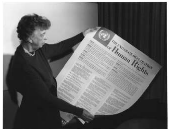
Eleanor Roosevelt toont in 1948 de Universele Verklaring van de Rechten van de Mens. Deze gaat uit van drie basisprincipes: universaliteit, gelijkheid/non-discriminatie en ondeelbaarheid.