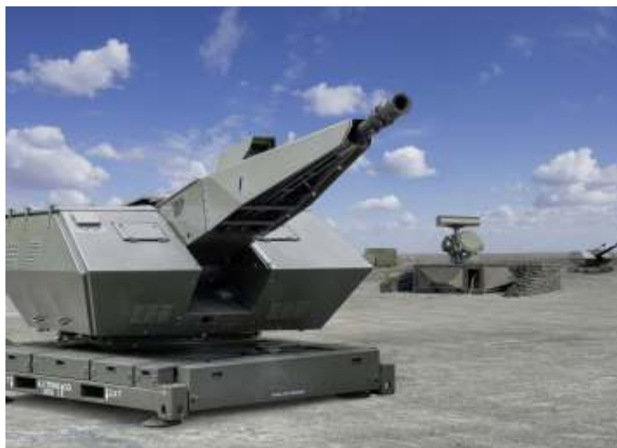
Een Skynex systeem in grondopstelling.