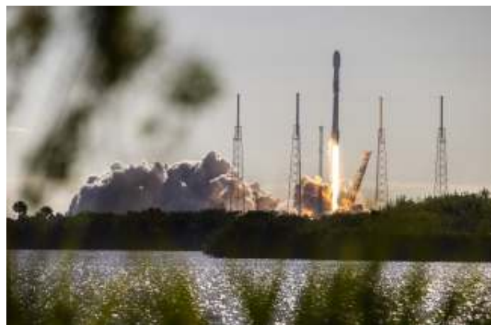
Raketlancering van de satellieten Birkeland en Huygens vanaf Cape Canaveral Space Force Station in Florida.