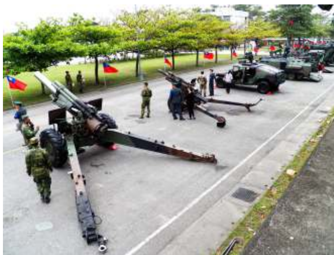
Taiwanese houwitsers. China beschikt over bijna vijf keer zo veel vuurmonden als Taiwan.