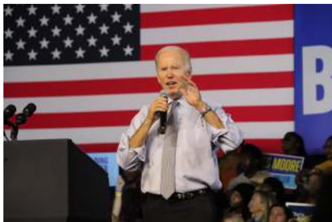
President Biden heeft inmiddels diverse malen verklaard Taiwan bij Chinese agressie te hulp te snellen.

De banden tussen Beijing en Taipei en de twee economieën zijn desondanks gegroeid. Tussen 1991 en eind mei 2021 bedroegen de Taiwanese investeringen in China in totaal $ 193,5 miljard, blijkt uit Taiwanese officiële cijfers. Sommige Taiwanese maken zich zorgen dat hun economie nu afhankelijk is van China. Anderen geloven dat nauwere zakelijke banden Chinese militaire actie minder waarschijnlijk maken, vanwege de kosten voor de eigen economie van China.