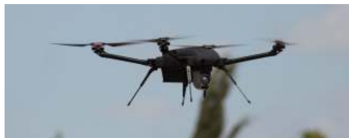
Een Magni-X microdrone tijdens de vlucht.