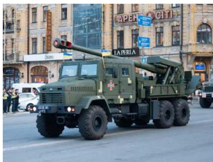
Een 2S22 Bohdana houwtiser tijdens een parade in Kiev.