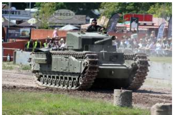
Een Churchill Mark III tijdens het Tankfest van 2019 in Bovington.