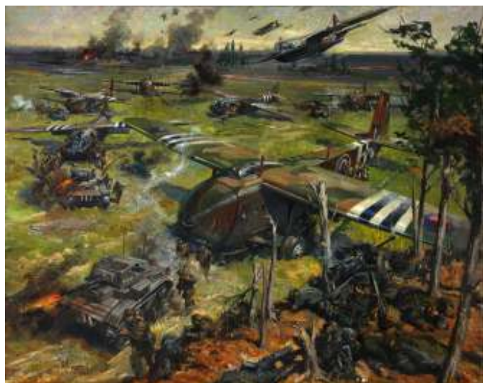
Een invasie met Horsa en Hamilcar zweefvliegtuigen en Tetrarch lichte tanks. Afbelding: Wikimedia Commons, schilderij van Terence Cuneo

De laatste uit de serie lichte tanks was de Mark VIII (A25). De productie van deze iets zwaardere opvolger van de Tetrarch bedroeg ongeveer honderd stuks. Deze zijn echter nooit operationeel ingezet. De tank kreeg de bijnaam 'Harry Hopkins' (zie kader op bladzijde 16).