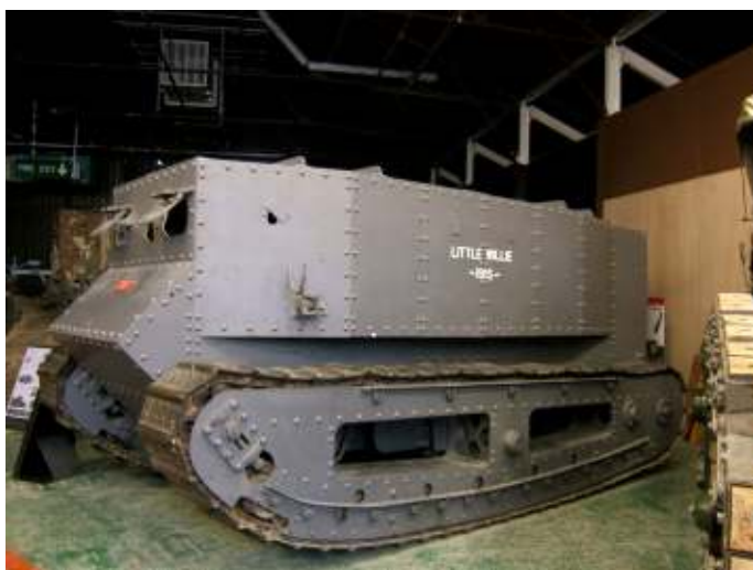
Number 1 Lincoln Machine, ofwel 'Little Willie' in het Tankmuseum in Bovington.

De Britten ontwikkelden dit type tank steeds verder. De opvolger van de Mark I was de Mark II, waarvan vijftig stuks werden gebouwd. De opvolger van de Mark II was de Mark III, waarvan er ook vijftig exemplaren werden geproduceerd. Hierna verscheen de Mark IV. Van dit type werden meer dan 1.200 stuks gebouwd. De Mark IV werd op zijn beurt opgevolgd door de Mark V, 400 stuks. Dit laatste type werd doorontwikkeld. Er verschenen verlengde versies met de aanduiding Mark V* (579 exemplaren werden tot deze versie omgebouwd) en Mark V** (25 stuks). Geen van deze tanks kreeg een naam. Dat was anders met de laatste versie uit de serie zware tanks, de Mark VIII. Deze geheel nieuw ontworpen en zwaardere tank (ruim 37 ton), die ook