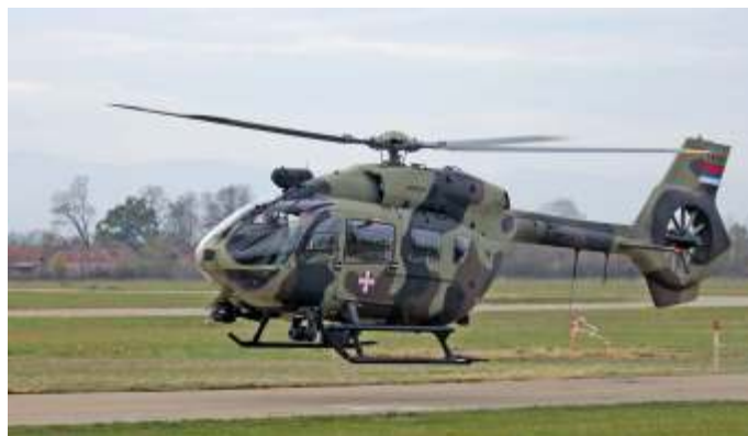
Een H145M in Servische dienst.