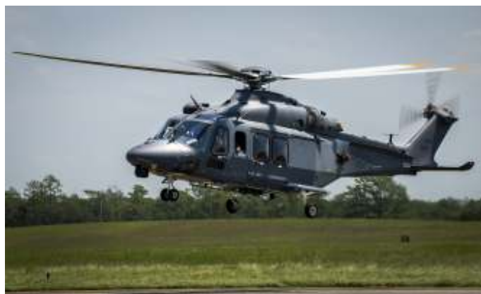
De MH-139 Grey Wolf helikopter.