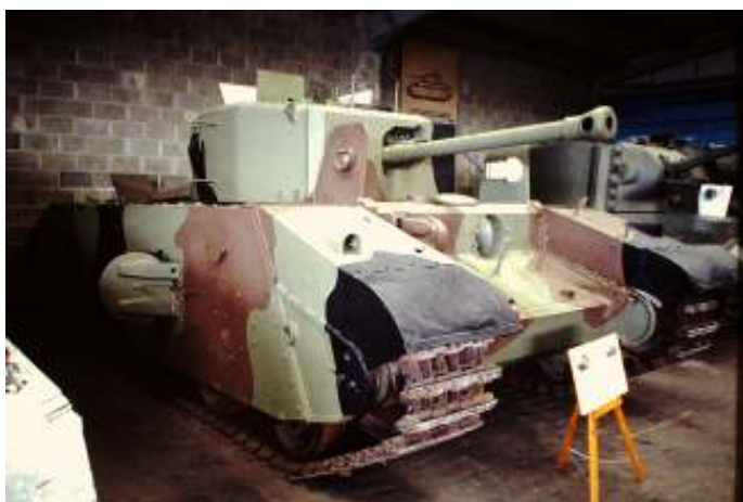
Een zware aanvalstank A33 Excelsior in het Tankmuseum in Bovington.