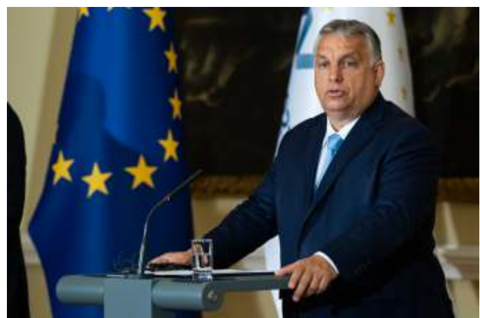
Premier Viktor Orban van Hongarije. Zijn land ziet meer in een staakt-het-vuren dan in het verhogen van de Europese schuldenberg.