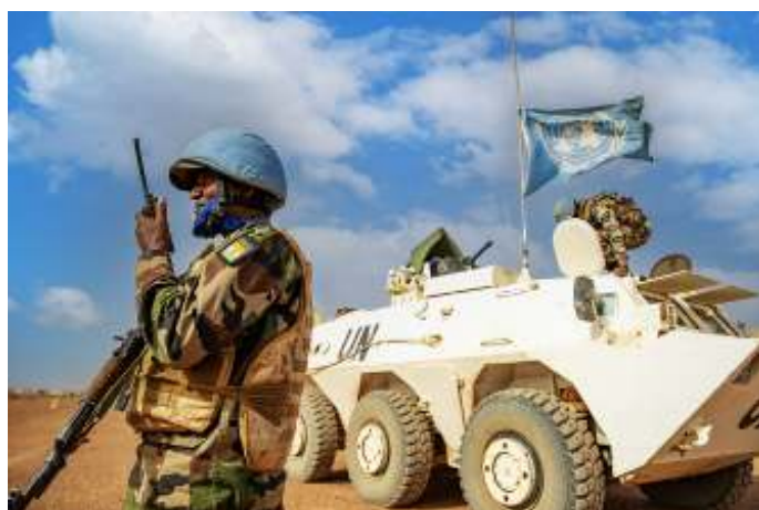
Als reactie op deze regio-brede onrust zijn er meerdere Westerse, Afrikaanse, en multilaterale missies opgezet om landen in de Sahel te stabiliseren, zoals MINUSMA.