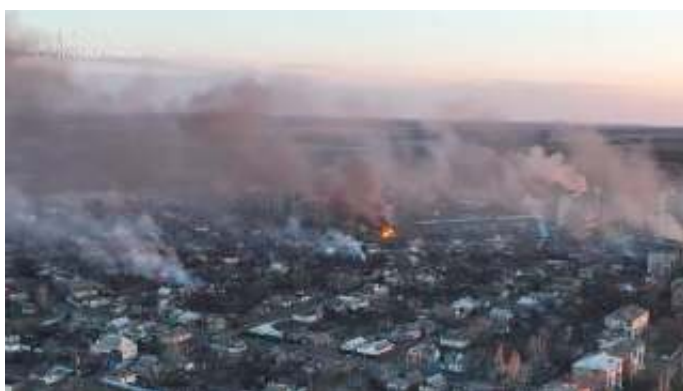
Bachmoet in mei 2023. De Wagner Groep leverde een cruciale bijdrage aan de Russische opmars in deze stad.

Tijdens fase twee werd Wagner-personeel uitgezonden naar Syrië. De geografisch strategische ligging van Syrië in het Midden-Oosten en het feit dat het Assad-regime het Kremlin gunstig gestemd was motiveerde het Kremlin om de situatie in het land te stabiliseren. De directe betrokkenheid bij de Syrische burgeroorlog zorgde voor de grootste buitenlandse inzet van Russische eenheden sinds het einde van de Koude Oorlog – hoewel het hier om niet formeel erkende eenheden ging. Opnieuw was Wagner niet de enige betrokken PMC, aangezien "Syrië diende als een belangrijke proeftuin voor de toepassing van een hybride PMC-implementatiemodel, dat sindsdien naar andere slagvelden is geëxporteerd..." (geciteerd uit Jones et al., 32 [3]). Initieel werden Wagner-troepen ingezet voor 'traditionele' functies geassocieerd met PMC's, zoals de beveiliging van olievelden, infrastructuur en overheidsfunctionarissen. Naarmate het conflict vorderde, nam Wagner expliciete gevechtstaken op zich en raakte direct betrokken bij militaire operaties, een geheel nieuwe ontwikkeling voor PMC's wereldwijd. Een duidelijk voorbeeld van deze nieuwe rol is een aanval van Russisch-Syrische strijdkrachten op een Koerdisch-Amerikaanse basis in februari 2018, wat leidde tot tussen de honderd en tweehonderd dodelijke slachtoffers aan Russische zijde. Echter, hier werd ook een belangrijk voordeel van PMC-inzet