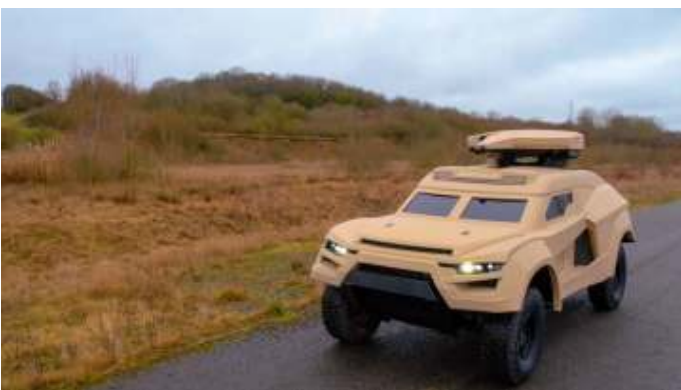
Animatie van de Cockerill i-X.