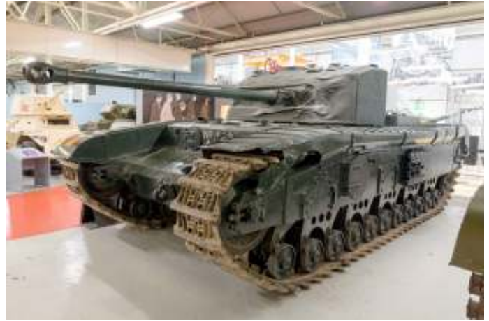
Een Infanterietank Black Prince, A43 in het Tankmuseum in Bovington.

Edward van Woodstock (1330 -1376), staat in de geschiedenis bekend als de Zwarte Prins . Hij was de oudste zoon en beoogd opvolger van koning Edward III van Engeland. Hij overleed echter voor zijn vader, die daardoor werd opgevolgd door Edwards zoon, Richard II. De Zwarte Prins was een van de bekwaamste Engelse veldheren tijdens de Honderdjarige Oorlog (1137-1453) en werd door zijn tijdgenoten beschouwd als een van de meest ridderlijke personen van zijn tijd.