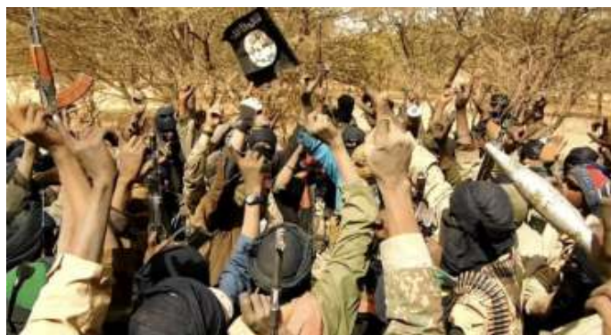
De Sahel is een broeinest geworden van Islamitische extremisten.

Moskou maakt hierbij gebruik van de Wagner Groep. Dit particuliere militaire bedrijf verleent veiligheidsdiensten, en is betrokken bij mijnbouw, handel, propaganda en beïnvloeding van operaties. De huurlingengroep behartigt gewapenderhand Ruslands militaire en economische belangen en het heeft van oorlogsmisdaden zo'n beetje haar handelsmerk gemaakt.