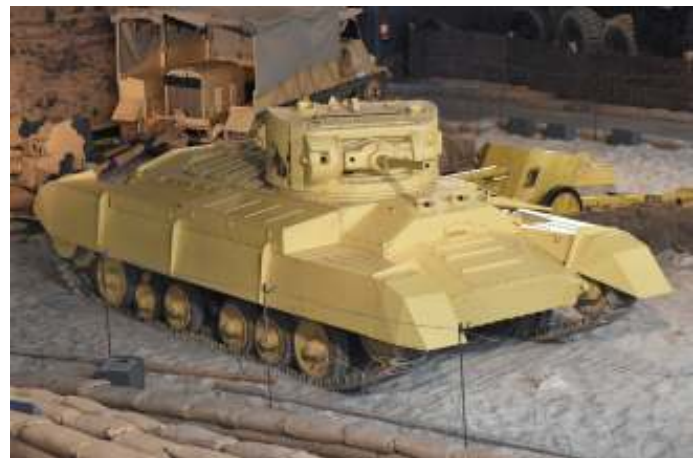
Een Valentine Mark II uit de collectie van het Imperial War Museum tentoongesteld in de Land Warfare Hall op Duxford Airfield.