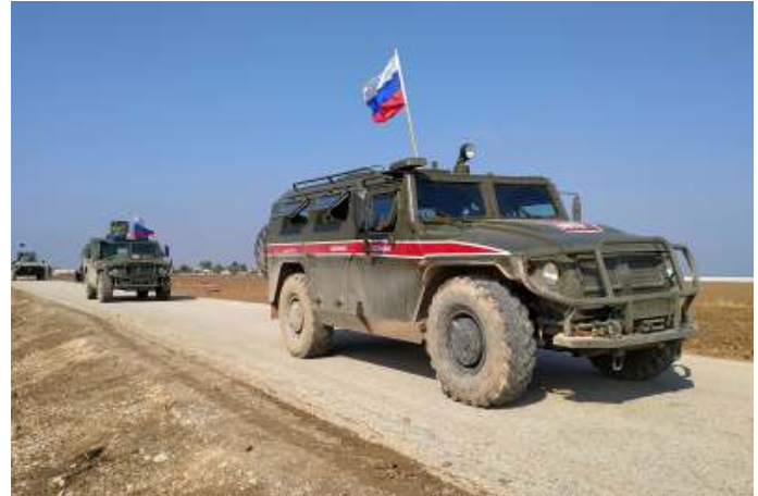
De directe betrokkenheid bij de Syrische burgeroorlog zorgde voor de grootste buitenlandse inzet van Russische eenheden sinds het einde van de Koude Oorlog.

De vijfde fase volgde met de inzet van Wagner in de oorlog met Oekraïne. Daarover meer in de volgende paragraaf.