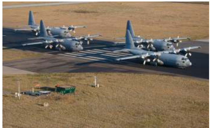
De Koninklijke Luchtmacht heeft momenteel vier C-130H Herculesen.

[1] De HAW is het operationele organisatiedeel van de SAC (hoofdredacteur).