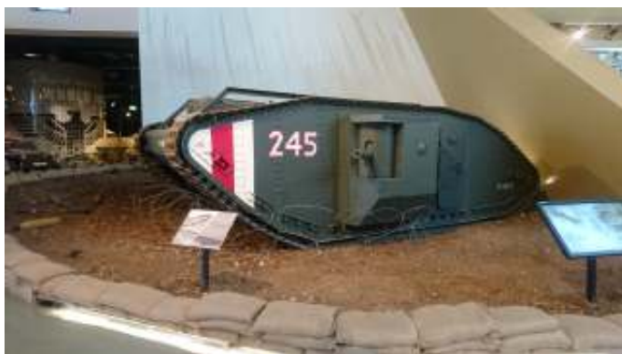
Een Tank Mark I (Mother) in het Jordaanse Royal Tank Museum in Amman.