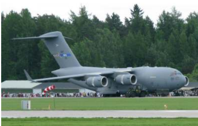
De Nederlandse behoefte wordt voor een deel ingevuld door onze nationale trekkingsrechten in het Heavy Airlift Wing C-17-programma.