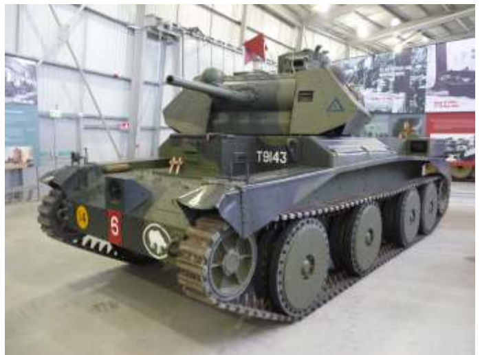
Een Cruiser Tank Mark III, A13 Mark I in het Tankmuseum, Bovington.

De eerste cruiser tank was een doorontwikkeling van de Medium Mark III, maar lichter en uitgerust met een commercieel verkrijgbare motor. Deze Cruiser Tank Mark I kreeg de aanduiding A9. Het ruim twaalf ton zware voertuig had als hoofdbewapening een tweeponder (40 mm) kanon en daarnaast mitrailleurs. Het had een topsnelheid van veertig km/u. De Mark I ging in 1937 in productie en er werden 125 stuks gebouwd, die van 1938 tot 1941 operationeel zijn ingezet. Zijn opvolger, de Mark II (A10), was twee ton zwaarder en – omdat hij over dezelfde motor beschikte – een stuk langzamer. De maximumsnelheid was slechts 26 km/u. Van deze tank werden 175 stuks geproduceerd. Het laatste type cruiser tank uit het interbellum was de vanaf 1938 geproduceerde Cruiser Tank Mark III. Om de verwarring over de diverse marks te vergroten kreeg hij van de Generale Staf de aanduiding A13 Mark I. Ondanks zijn hogere snelheid (48 km/u) was hij, evenals zijn voorgangers, niet opgewassen tegen de Duitse tanks. De productie bedroeg 65 stuks. Omdat hij onvoldoende gepantserd was, werd een verbeterde versie ontwikkeld, de Cruiser Tank Mark IV, A13 Mark II. Hiervan werden ruim 650 stuks geproduceerd. Ook deze cruiser tanks werden tot 1941 operationeel ingezet.