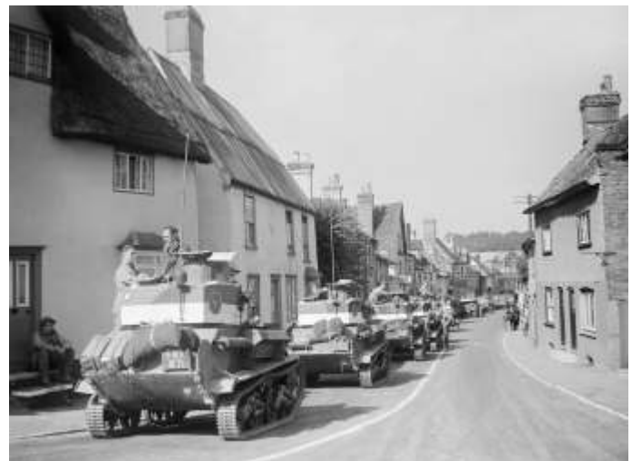
Lichte tanks Mark VI rijden door een dorp in Cambridgeshire, juli 1940.