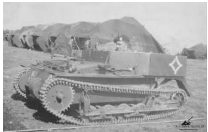
Een Carden Loyd Mark VI 'tankette' van 2 Battalion, Royal Tank Corps.

Afbeelding: Wikimedia Commons, een tekening van Bernard Adeney