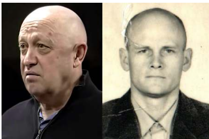
Centrale figuren binnen de Wagner Groep waren Dmitri Oetkin (rechts) en Jevgeni Prigozjin.

De Wagner PMC is waarschijnlijk in 2014 opgericht na samenvoeging van andere, particuliere beveiligingsbedrijven