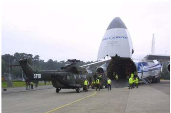
Een Antonov An-124-100 op vliegbasis Soesterberg. De Cougar, op de staart voorzien van het opschrift SFIR, van Helidetachment 8 ingedeeld bij de Stabilization Force Iraq 4 (SFIR-4) wordt in 2004 naar de Antonov gebracht.