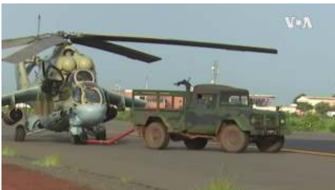
Russische gevechtshelikopter in Mali. Rusland boekte het meeste succes in internationaal geïsoleerde en gestreste Sahel-staten.