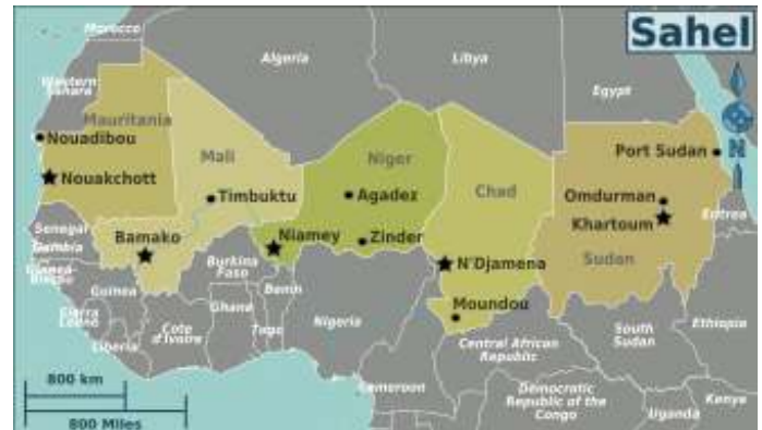
De Sahel.

PMC's het Kremlin een unieke kans om de invloedssfeer uit te breiden zonder de beperkingen, kosten, en risico's van officiële economische, diplomatieke, en militaire missies. Het feit dat Wagner na de dood van Oetkin en Prigozjin niet werd opgeheven maar juist actief werd ingelijfd bij het Ministerie van Defensie lijkt deze gedachtegang te bevestigen. Bovendien moet de inzet van andere, nieuwe PMC's door (gedeeltelijke) staatsbedrijven zoals Gazprom ook niet onopgemerkt blijven [16].