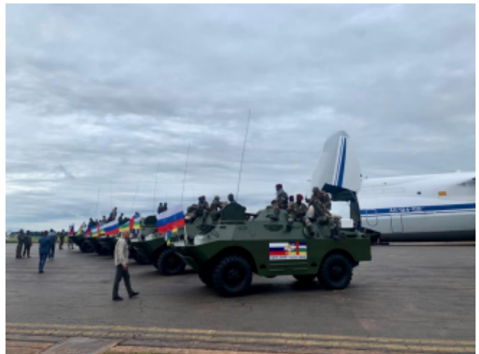
Wagner is al sinds 2017 actief in de Centraal Afrikaanse Republiek.