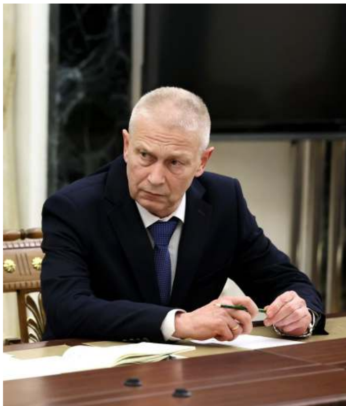
Het Kremlin heeft Andrei Trosjev, een oudgediende van Wagner, aangewezen als nieuwe leidinggevende.

De combinatie van quasi-ontkenbaarheid en onnavolgbaarheid verklaart tevens de voorkeur voor inzet van Wagner in het buitenland. Nogmaals, PMC's bieden het Kremlin een unieke kans om de internationale positie van Rusland te herdefiniëren middels lage kosten en risico's en mogelijk hoge resultaten [13]. Lage kosten stellen het Kremlin in staat voet aan de grond te krijgen in gebieden waar Rusland normaliter militair (Frankrijk, VS) of economisch (China) een kleine of geen rol speelt. Lage risico's dienen zich aan in de vorm van het vermijden van directe confrontatie met deze andere grootmachten. Zoals het eerdergenoemde incident in Syrië illustreert, kan het Kremlin enig verband met PMC's ontkennen mochten zaken uit de hand lopen. Tegelijkertijd biedt de inzet van ervaren personeel in instabiele regio's een grotere kans op hoge resultaten. Dit verklaart de recente focus van Wagner op een specifieke regio: de Sahel.