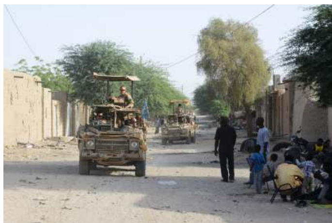
Nederlandse patrouille in Timboektoe. De activiteiten van internationale eenheden in de Sahel behoren, vaak tegen wil en dank en mede door hun beperkte mandaten, inmiddels grotendeels tot het verleden.

Sinds 2020 hebben verscheidene militaire staatsgrepen plaatsgevonden in de regio