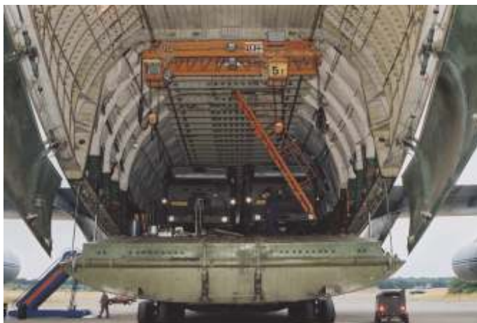
De An-124 is geen onbekende op Nederlandse vliegbases. Een kijkje in de enorme laadruimte van de Antonov 124-100 tijdens inzet voor operatie Provide Care in Zaïre in 1994.

Naast de HAW- en MRTT-optie zijn er nog andere samenwerkingsverbanden waar Defensie de benodigde capaciteit kan aanvragen. “Zo is er het Movement Coordination Centre Europe op Vliegbasis Eindhoven. Naast dit MCCE is daar ook het European Air Transport Command ondergebracht.” Dat kijkt multinationaal naar het optimaliseren van militaire middelen van de aangesloten deelnemers. “Nederland is sinds 1 januari 2024 verder aangehaakt bij de Strategic Air Lift Coordination Cell: SALCC. Die stemt op datzelfde veld