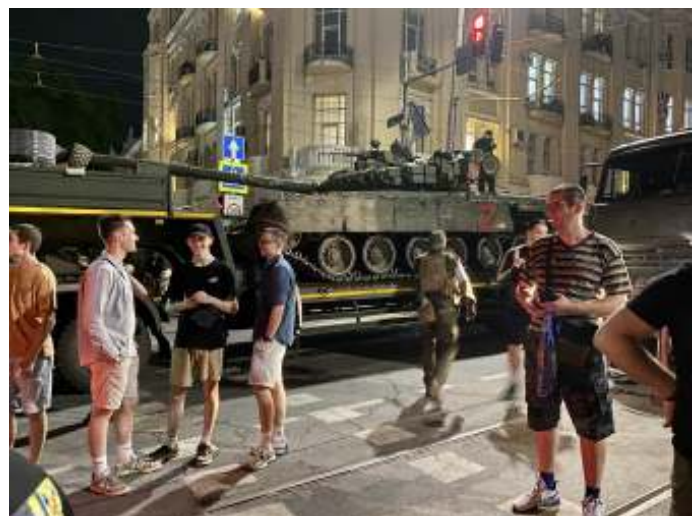
Een tank van de Wagner Groep tijdens de muiterij in Rostov-aan-de-Don. Door de muiterij werd waardevolle informatie prijsgegeven.