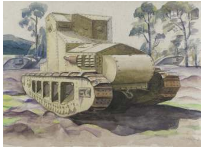
Een 'artist impression' van een Medium Tank Mark A Whippet met op de achtergrond zware tanks.

In de jaren dertig werden zes types lichte tank gebouwd, Mark I t/m Mark VI. Oorspronkelijk waren het tweemansvoertuigen van tussen de vier en vijf ton, bewapend met mitrailleurs. De Mark V had drie bemanningsleden. Deze tanks werden in kleine aantallen geproduceerd en ingezet in de koloniën. Tot 1942 werden ze voornamelijk gebruikt voor training. Een klein aantal exemplaren werd operationeel ingezet in Noord-Afrika en Ethiopië. Het laatste type, de Mark VI, werd tussen 1936 en 1940 in grotere aantallen geproduceerd, in totaal ruim 1.600 stuks. Hij had (met de Mark V) de generale-stafaanduiding A5. De Mark VI werd ingezet in West-Europa en Noord-Afrika, maar was niet opgewassen tegen de Duitse tanks. De laatste operationele inzet vond plaats in 1948 tijdens de Israëlische Onafhankelijkheidsoorlog.