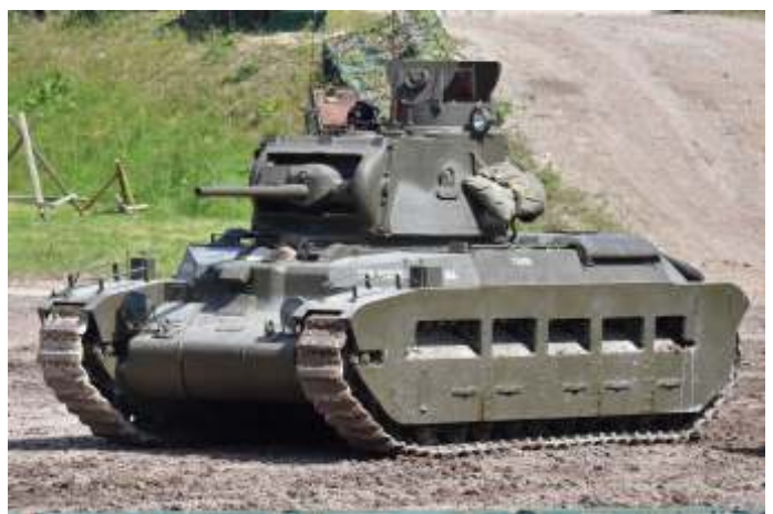
Een Infanterietank Mark II Matilda II (A12) tijdens een Tankfest in Bovington.

Ook in de Tweede Wereldoorlog handhaafden de Britten het onderscheid tussen lichte tanks, cruiser tanks en infanterietanks. Al deze tanks kregen in navolging van de Matilda's naast hun typeaanduiding een naam. De namen van de lichte en infanterietanks zijn willekeurig gekozen. Dat geldt niet voor de namen van de cruiser tanks. Deze beginnen allemaal met de letter C.