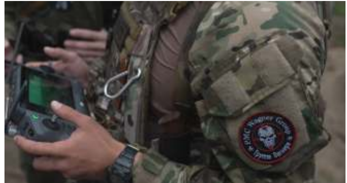
Moskou maakt in Afrika gebruik van de Wagner Groep.

Repressieve regimes in de Sahel hebben de kans gegrepen om met Moskou samen te werken. Maar ze zullen waarschijnlijk ervaren dat Russen niet slagen in het terugkrijgen van de controle over gebieden die verloren zijn gegaan aan de opstandelingen. Tegenwicht bieden aan de Wagner Groep en Russische 'kwaadaardige invloed' door middel van het oplossen van de sociale problemen dient een prioriteit te zijn voor het Westen!