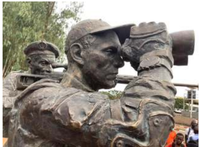
In de CAR werd een standbeeld geplaatst om Russische soldaten te eren.