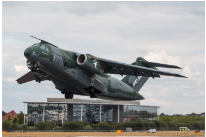
De Herculesen van de luchtmacht worden vervangen door vijf C-390M's.

NAVO-lidstaten sloten via de NATO Maintenance and Supply Agency, inmiddels NSPA, in januari 2006 een overeenkomst met Ruslan Salis GmbH. Dat bestond uit het Russische Volga-Dnepr Airlines en het Oekraïense Antonov Design Bureau, gevestigd in het Duitse Leipzig. Dat veranderde eind december 2016. De twee bedrijven kregen beide een contract: Antonov Salis GmbH en Ruslan Salis GmbH. Deze afspraken liepen op 31 december 2018 af. Antonov Logistics Salis is sindsdien de enige NAVO-partner waarmee de lidstaten zaken doen. Het huidige contract werd oktober 2021 gesloten en heeft een looptijd van vijf jaar. Lees meer hierover: https://bit.ly/salisnavo .