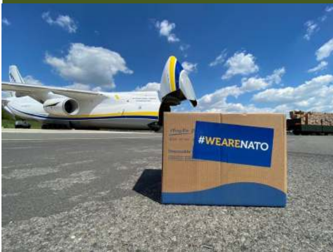
NAVO-lidstaten sloten via de NATO Maintenance and Supply Agency, inmiddels NSPA, in januari 2006 een overeenkomst met Ruslan Salis GmbH.

NAVO-lidstaten sloten via de NATO Maintenance and Supply Agency, inmiddels NSPA, in januari 2006 een overeenkomst met Ruslan Salis GmbH. Dat bestond uit het Russische Volga-Dnepr Airlines en het Oekraïense Antonov Design Bureau, gevestigd in het Duitse Leipzig. Dat veranderde eind december 2016. De twee bedrijven kregen beide een contract: Antonov Salis GmbH en Ruslan Salis GmbH. Deze afspraken liepen op 31 december 2018 af. Antonov Logistics Salis is sindsdien de enige NAVO-partner waarmee de lidstaten zaken doen. Het huidige contract werd oktober 2021 gesloten en heeft een looptijd van vijf jaar. Lees meer hierover: https://bit.ly/salisnavo .