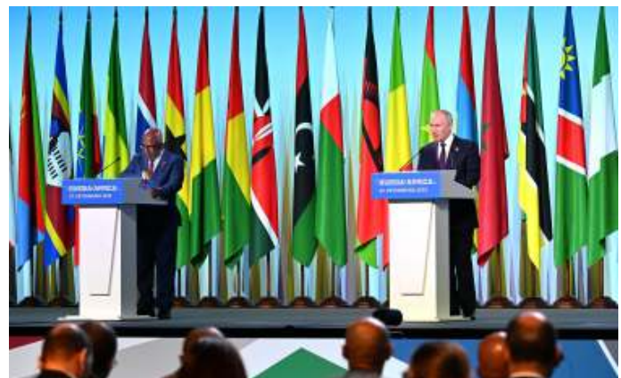
De breuk van het regime van Vladimir Poetin met het Westen versterkt de toenadering van Moskou tot verschillende delen van Afrika.