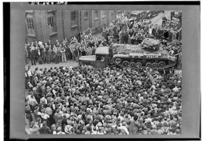
Een voor de Sovjet-Unie geproduceerde Infanterietank Mark III Valentine verlaat onder grote publieke belangstelling de fabriek.

Tot zover deze eerste aflevering. In de volgende aflevering worden de cruiser tanks uit de Tweede Wereldoorlog behandeld, alsmede een zware tank. Daarna staan we in die aflevering stil bij de naoorlogse Britse tanks.